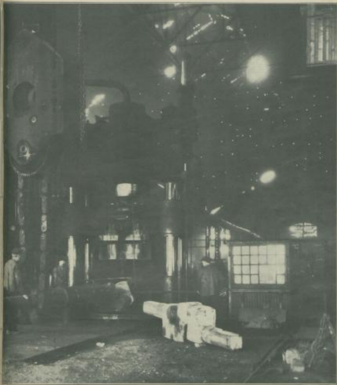
Waffenfabrik Bofors hochwertigster Stahl bis zu 50-Tonnen-Blöcken in Großgeschützrohrkörper verwandelt wird.