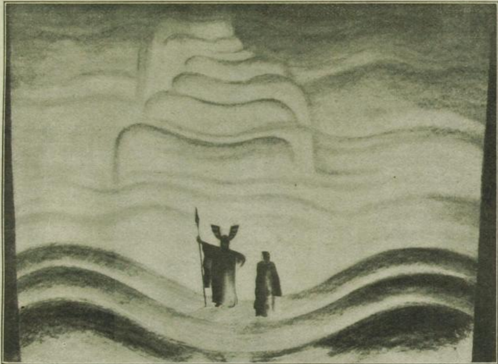
Wie man außerhalb von Bayreuth die Wagnerschen Musikdramen inszeniert: Eine Rheingold-Dekoration aus der mustergültigen Aufführung des Frankfurter Opernhauses. (Entwurf von L. Sievert)