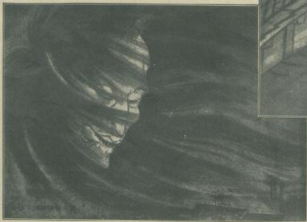
Kuniyoshi: Geisterhaupt im Sturm