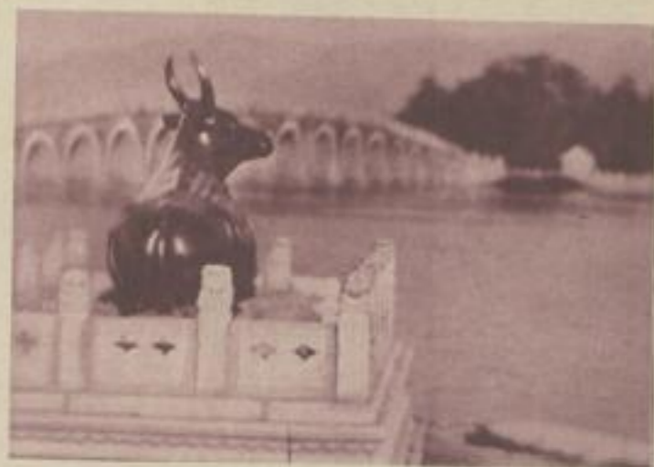
Heilige Kuh vor dem Kaiserlichen Palast