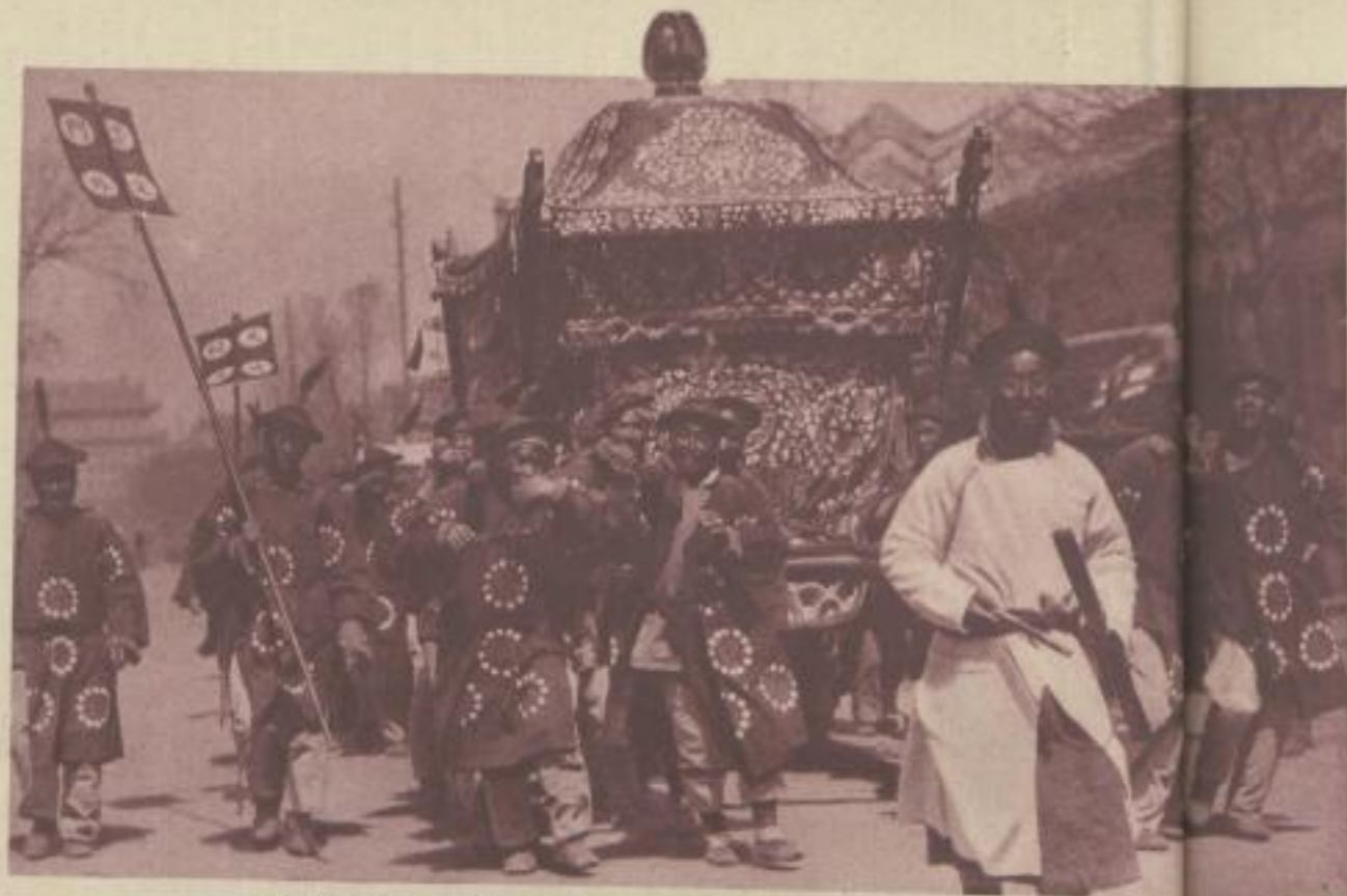
Strafenszene in Peking: Leichenträger mit einem Kasafalk