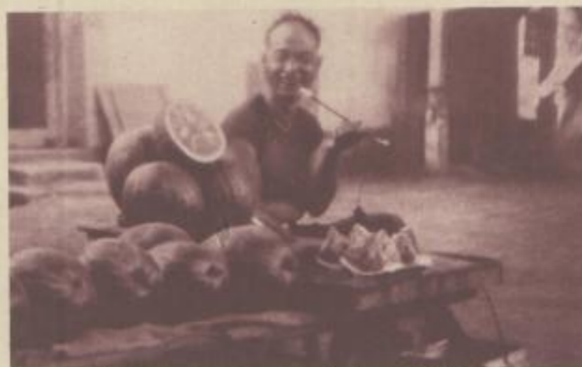
Melonenverkäufer auf den Straßen von Peking