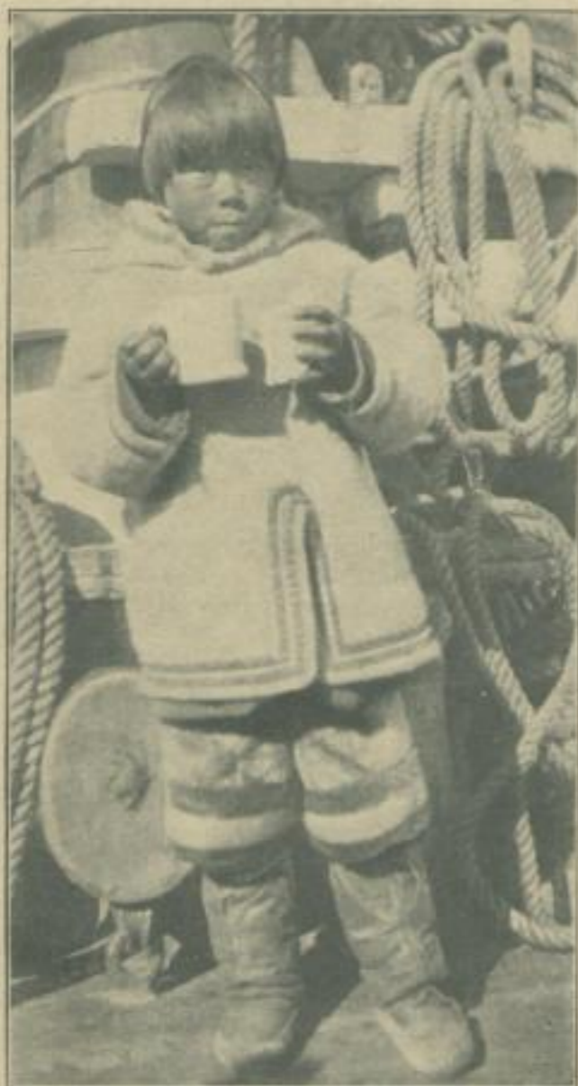
Ein Eskimokind zu Besuche an Deck eines Polarschiffes

Erde das alte Abenteuer wie in den ältesten Zeiten. Man kommt langsam hin und unter Gefahren wieder fort. Wir wissen heute mehr von diesen Ländern, denn der Photograph und der Kurbelmann sind wichtige Begleiter des Wissenschaftlers, des Forschers. Sie bringen die