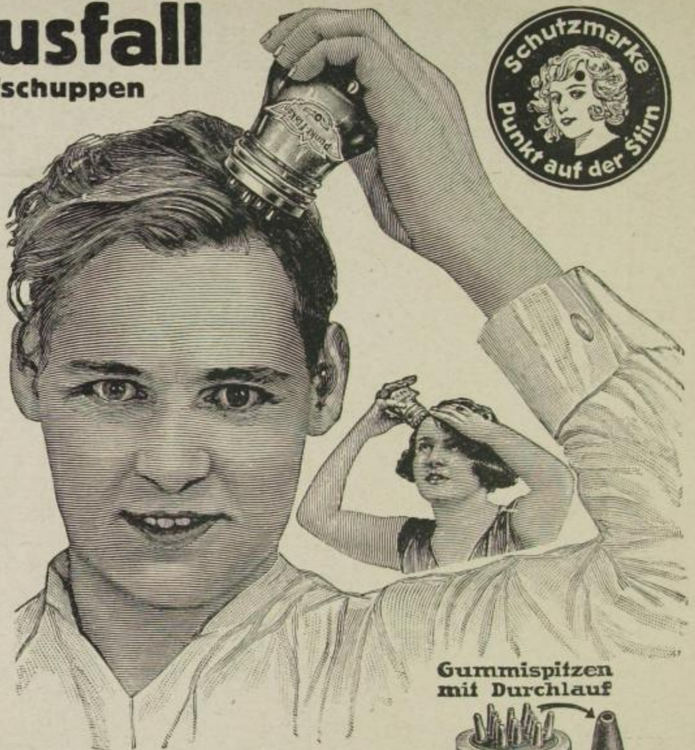
Gummispitzen mit Durchlauf

Um diese »Punkt-Tropfen« richtig bis in die Haarscheide zu bringen, werden sie im »Punkt-Flakon« geliefert. Der Apparat »Punkt-Flakon« (Patente angemeldet) ermöglicht nicht nur die so wichtige Kopfmassage, welche zu einer guten Durchblutung der Kopfhaut, also Ernährung des Haares nötig ist, sondern füllt während der Massage durch seine hohlen Kautschukspitzen die »Punkt-Tropfen« direkt in die Haarscheide, wodurch die Zellen neu angeregt werden. Der natürliche Farbstoff vermehrt sich, und das frühzeitige Grauwerden des Haares wird hinausgeschoben. Der Erfolg ist eine erfrischende Reinigung und Kräftigung des Haarbodens und der Kopfnerven von ungeahnter Wirksamkeit.