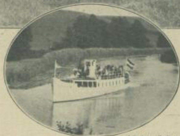
Natürlich fährt die „Oberland“ manchmal auch auf dem Wasser

In Ostpreußen, zwischen Osterode und Elbing, fährt zweimal am Tage ein Schiff einen sonderbaren Weg: die „Oberland“ klettert aus dem Wasser und fährt per Wagen auf Schienen über Berg und Land, um den nächsten See zu erreichen.