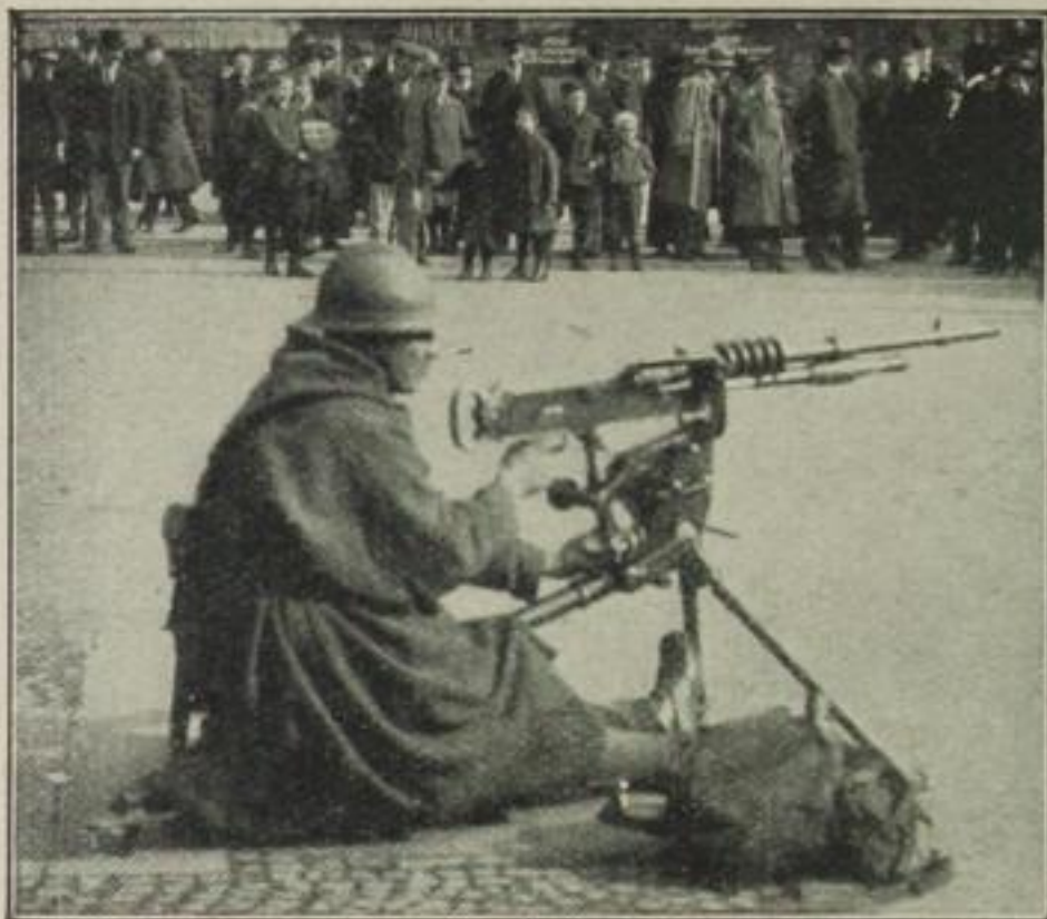
Französisches Maschinengewehr in Frankfurt a. M.