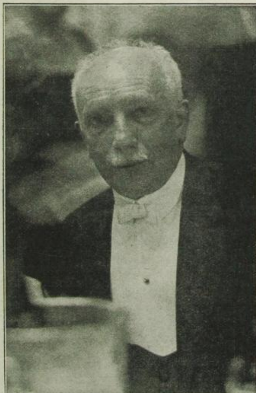
und wie er eine Sekunde später aussieht, als er den Photographen entdeckt