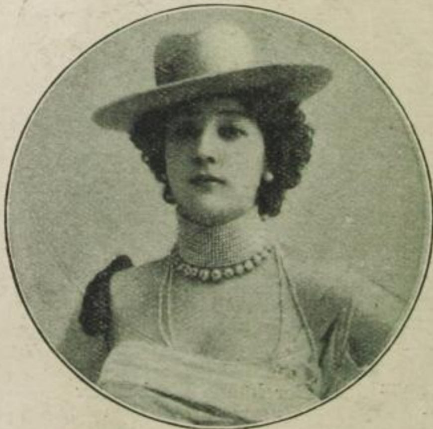
11. Eine Frau, deren Gesicht in den neunziger Jahren jeder kannte.