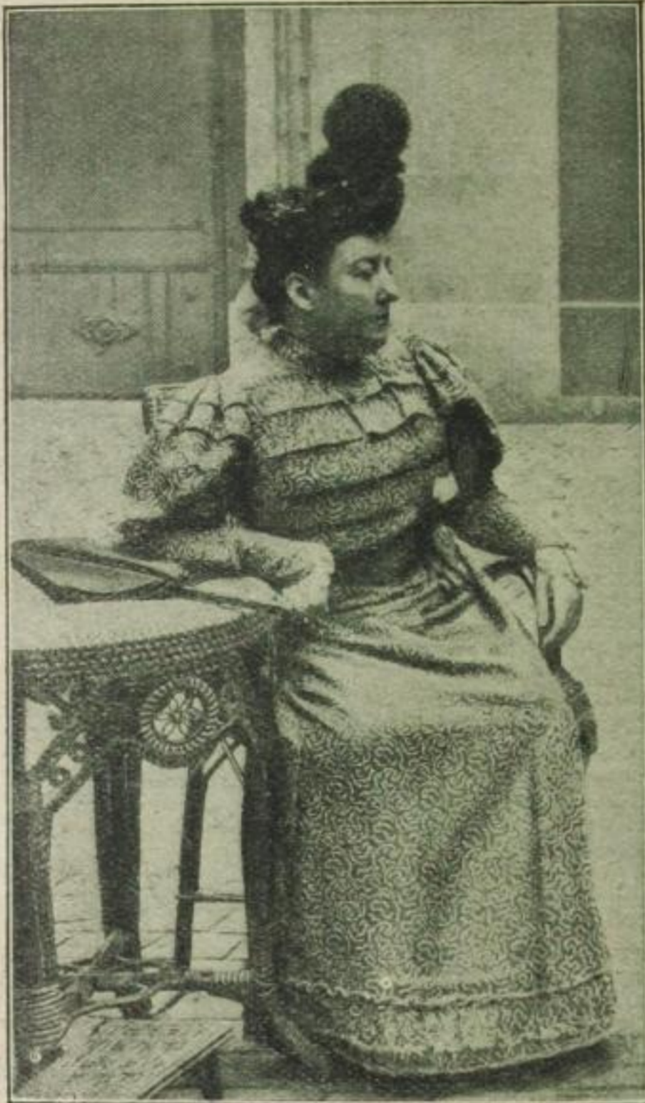
9. Erinnern Sie sich an diese Frau und ihre famose Geldaffäre?