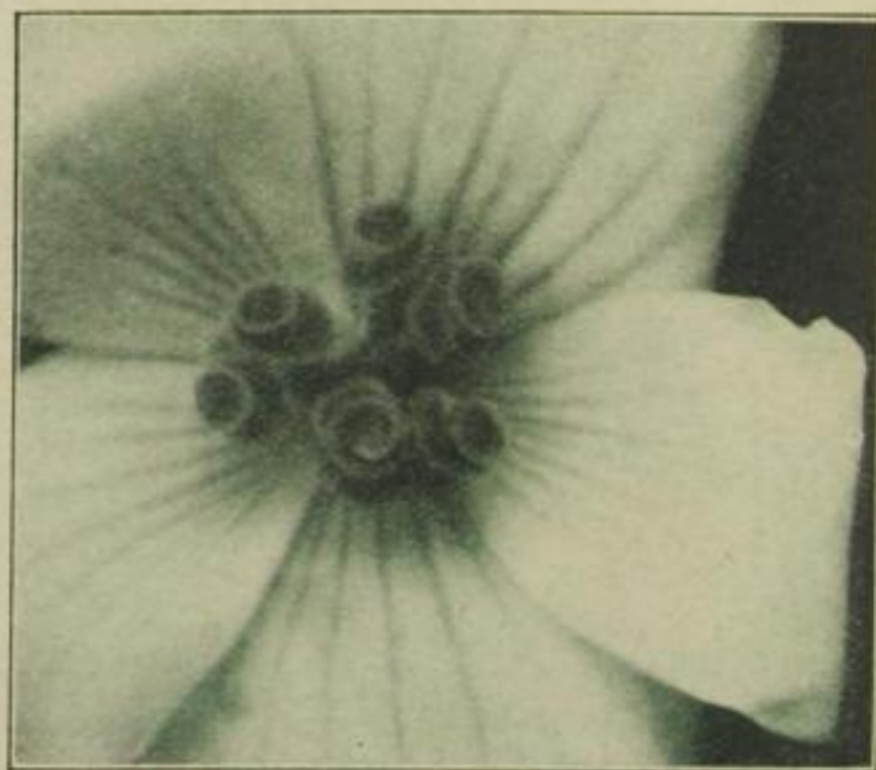
Weibliche Blüte der Begonie