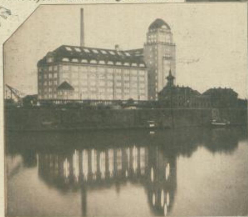
Nachtschicht in der Getreidemühle