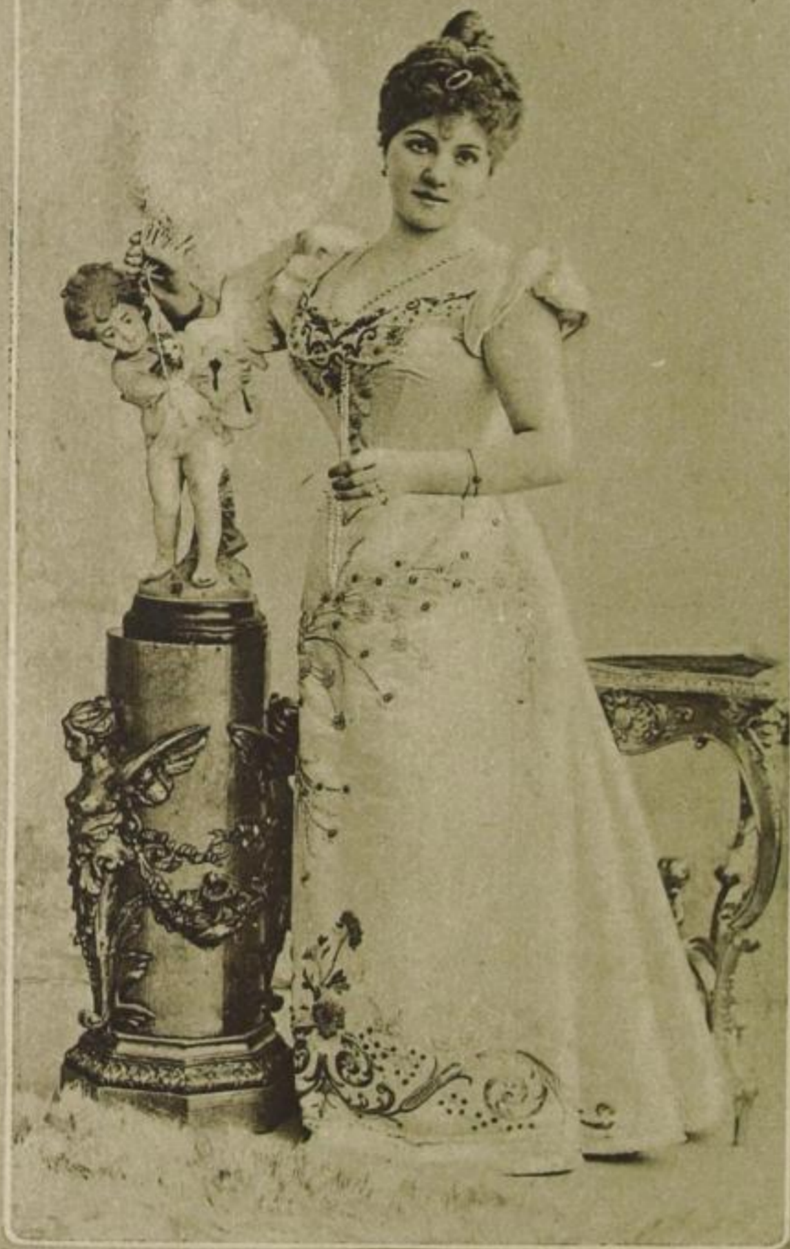
„Wissen Sie, wer das ist? Das ist mein Muttchen als Braut. Die Hochzeit war im Russischen Hof, 60 Personen. Muttchen sagt immer, da warst du aber noch nicht dabei.“

„Da hat doch schon wieder jemand ein Bild rausgenommen. Sicher Onkel Karl, der hat nämlich auch ein Familien-