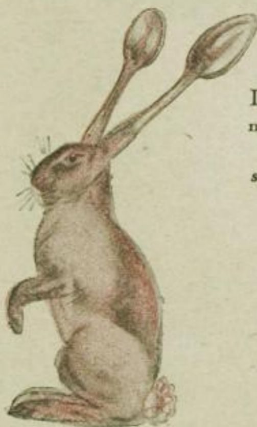
Die Hasenohren nennt er Löffel, den Hasenschwanz Blume.

Licht oder Seher = Auge des Wildes Lauscher, Gehöre = Ohren des Wildes Windfang = Nase einiger Wildarten Behänge = Ohren des Jagdhundes Geäse = Maul des Schalenwildes Lauf = Bein Decke = Fell des Schalenwildes Schalenwild = Wild, das auf Schalen geht Rauschzeit = Liebeszeit des Schwarzwildes Blattzeit = Liebeszeit des Rehwildes Balzzeit = Liebeszeit des Auer- und Birkwildes färben = Haarwechsel Fallwild = an Krankheit verendetes Wild Geheck — junge Füchse aus einem Wurf Losung = Kot des Wildes Geschmeiß = Kot der Raubvögel Fänge = Die bekrallten Zehen der Raubvögel