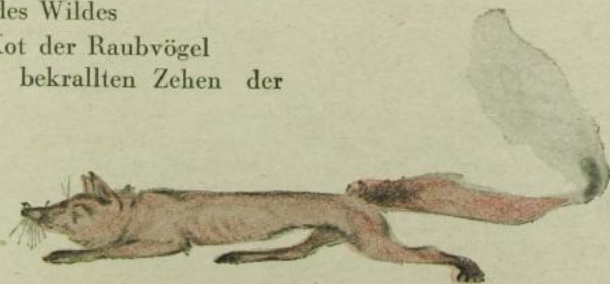
Den Schwanz des Fuchses nennt der Jäger Lunte.