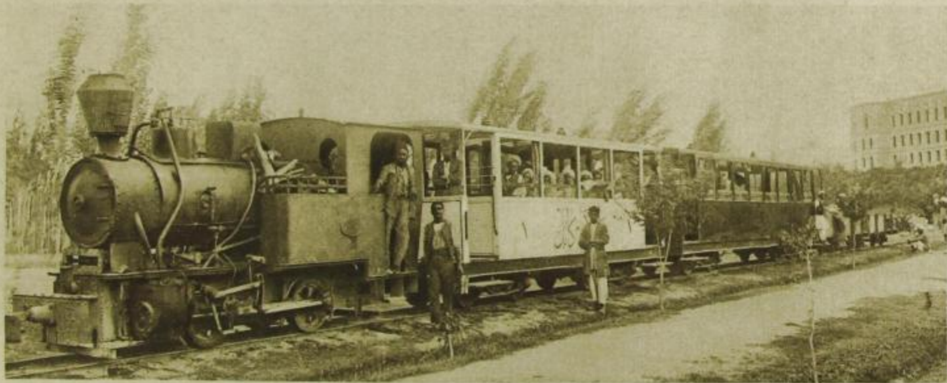
Die 7 km lange Eisenbahn zwischen Kabul und Darul-Aman war stark überfüllt.