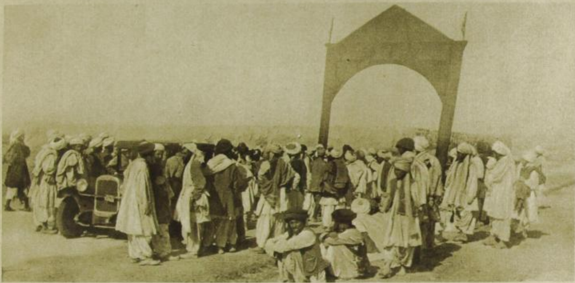
Berauscht vom Geiste des Abendlandes, kehrte er in seine Heimat zurück, wo ihm seine armen, aber ehrlichen Untertanen einen wenn auch kleinen Triumphbogen in der Wüste errichtet hatten.