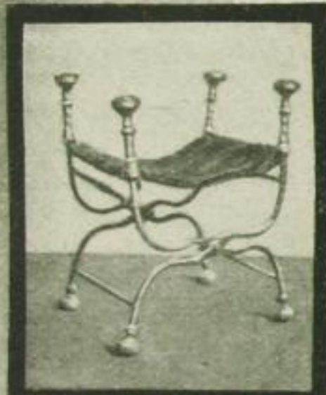
Sitzmöbel aus Eisen, 15. Jahrh.

... zu erfahren, daß schon im 15. Jahrhundert Möbel aus Eisen mit Bronze in Gebrauch waren. Diese Sitzmöbel der italienischen Renaissance zeigen den architektonischen Ausdruck ihrer Zeit.