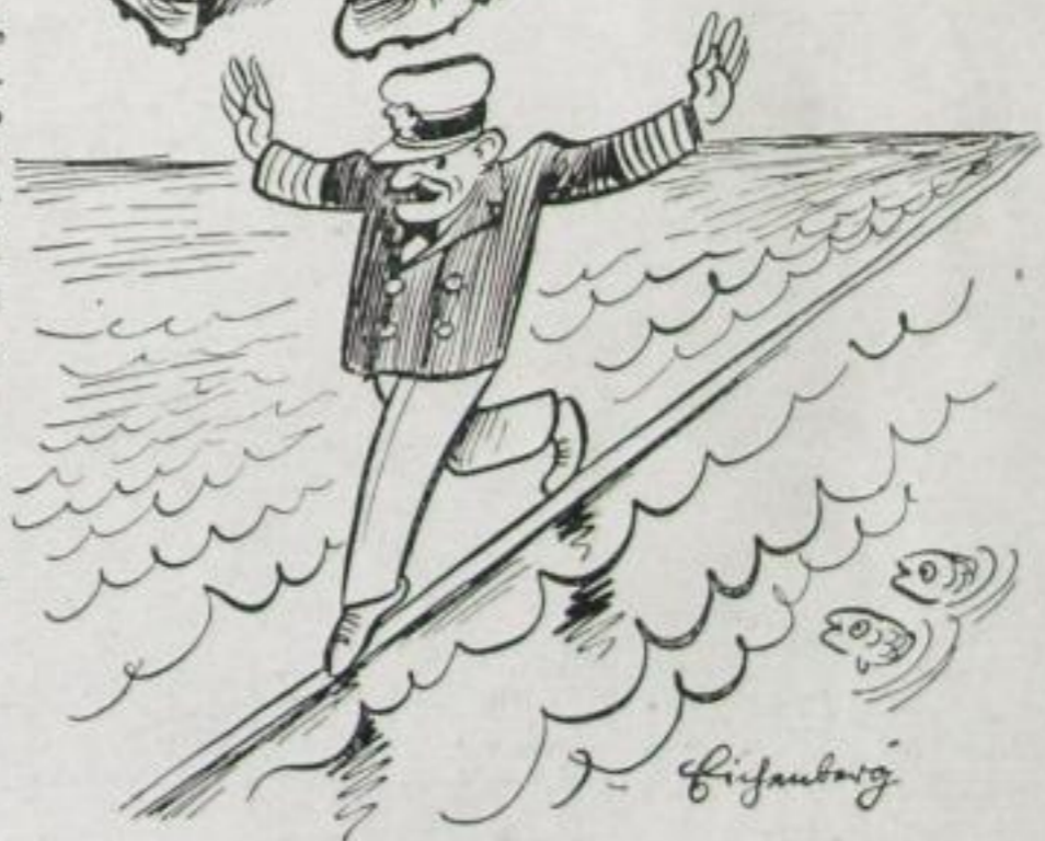
Zeichnung von Fritz Eichenberg