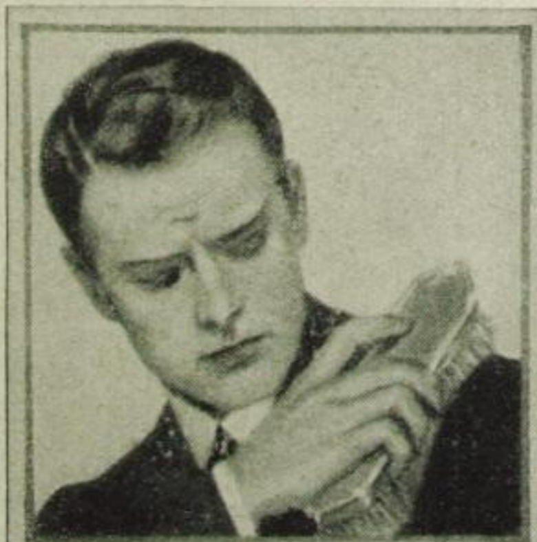
Dieser Mann weiß noch immer nicht, daß er mit unserm Mittel gegen Kopfschuppen nicht mehr nötig hätte, jede Stunde seinen Anzug abzubürsten.