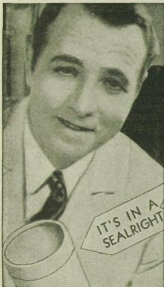
Dieser Mann freut sich, weil er eine so wundervoll versiegelte Käsepackung bei Myers Bros. entdeckt hat.

Was ist eigentlich mit diesen jungen Leuten los?