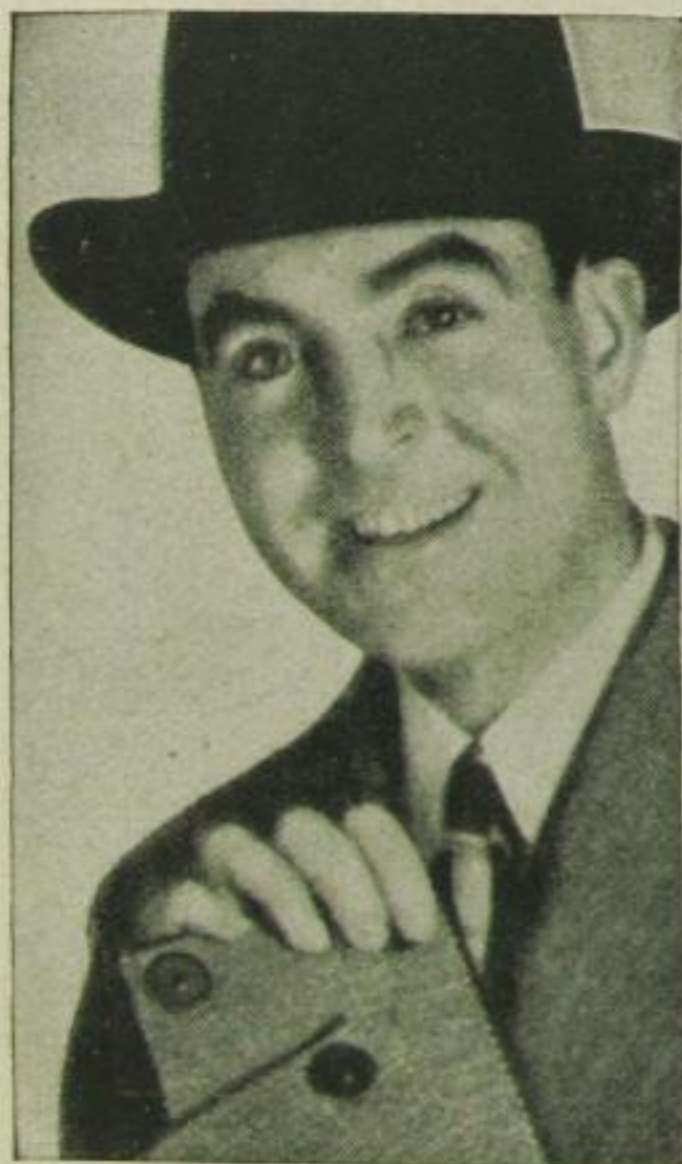
Dieser Mann ist so glücklich, weil er bei Marshall & Co. so vorzüglichen Hosenstoff gekauft hat.