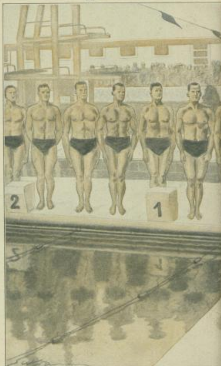
Zeichnung von Wilhelm Kreis