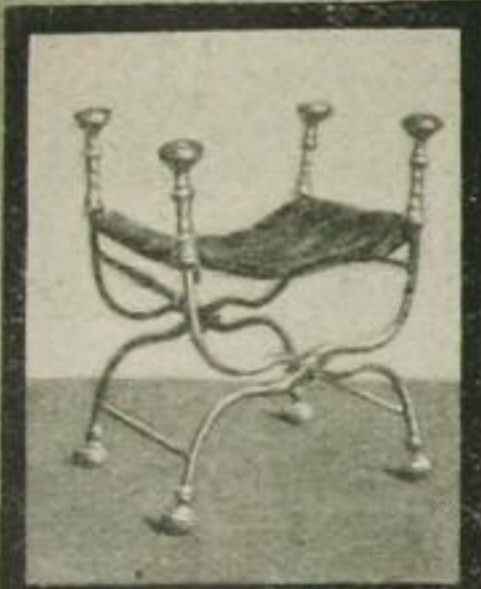
Sitzmöbel aus Eisen, 15. Jahrh.

... zu erfahren, daß schon im 15. Jahrhundert Möbel aus Eisen mit Bronze in Gebrauch waren. Diese Sitzmöbel der italienischen Renaissance zeigen den architektonischen Ausdruck ihrer Zeit.