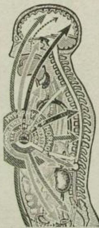
Graphische Darstellung der verschiedenen Bestandteile und der vielseitigen Angriffspunkte der „Titus-Perlen“

klagen oft über vorzeitiges Altern und Schwinden der besten Kräfte. Die Diagnose lautet fast immer: Verminderung bzw. Aufhören der Tätigkeit der Drüsen mit innerer Sekretion. Führen Sie Ihrem Körper die lebenswichtigen Testis- und Hypophysen-Hormone, die in den „Titus-Perlen“ zum ersten Male in gesicherter standardisierter Form enthalten sind, zu. „Titus-Perlen“ sind das wissenschaftlich anerkannte unschädliche Kombinationspräparat, das alle Möglichkeiten medikamentöser Potenzsteigerung berücksichtigt. Sie sind das Ergebnis jahrzehntelanger Forschung des bekannten Sexualwissenschaftlers San.-Rat Dr. Magnus Hirschfeld. „Titus-Perlen“ werden hergestellt unter ständiger klinischer Kontrolle des Berliner Instituts für Sexualwissenschaft. Lassen Sie sich zunächst über die Funktionen der menschlichen Organe durch die zahlr. fünffarb. Bilder der wissenschaftl. Abhandlung unterrichten, die Sie sofort kostenlos erhalten durch die „Titus“ Chemisch-pharmaz. Fabrik G. m. b. H., Bln.-Pankow 172. Titus-Perlen zu haben in allen Apotheken.