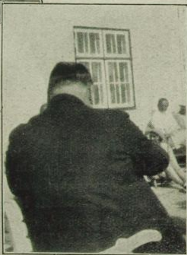
Pappi (Der Herr hinten an der Wand)