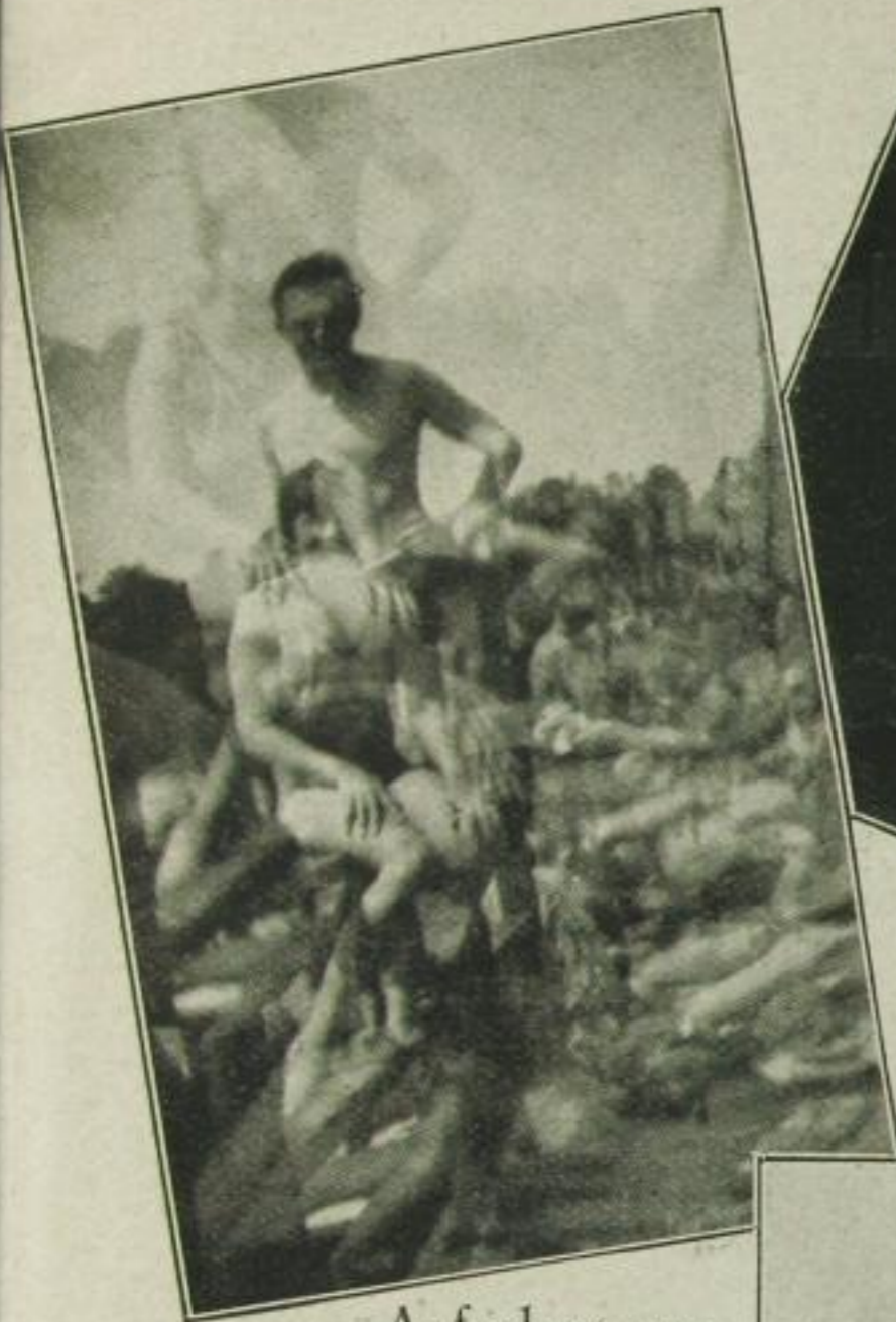
Aufnahme vom Badestrand