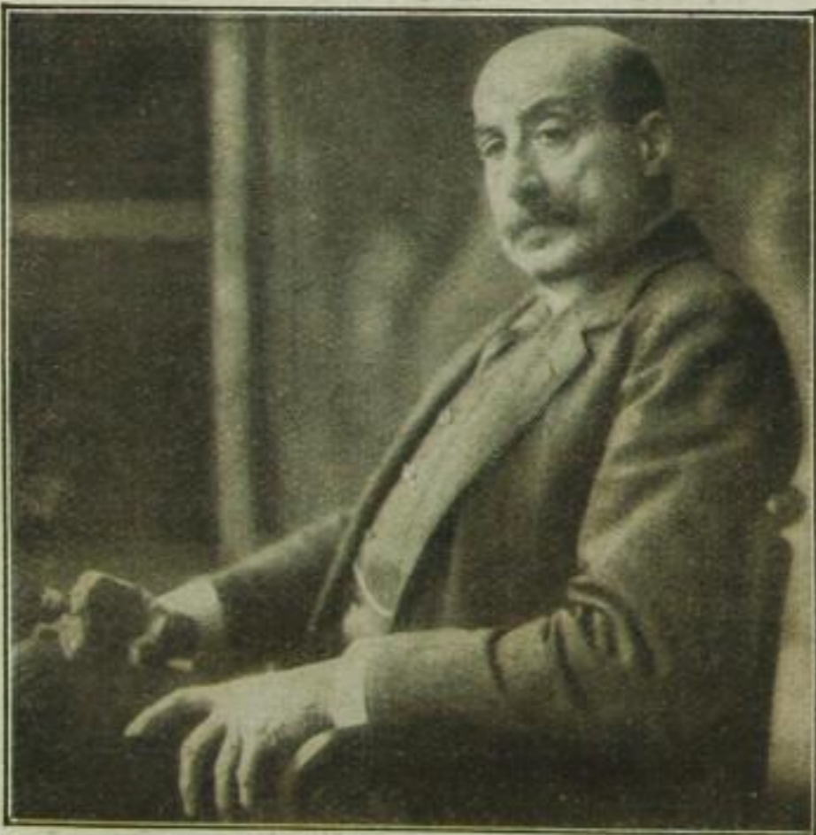
Max Liebermann mit 70 Jahren

Ein ganzes Leben lang dieselbe Handhaltung: