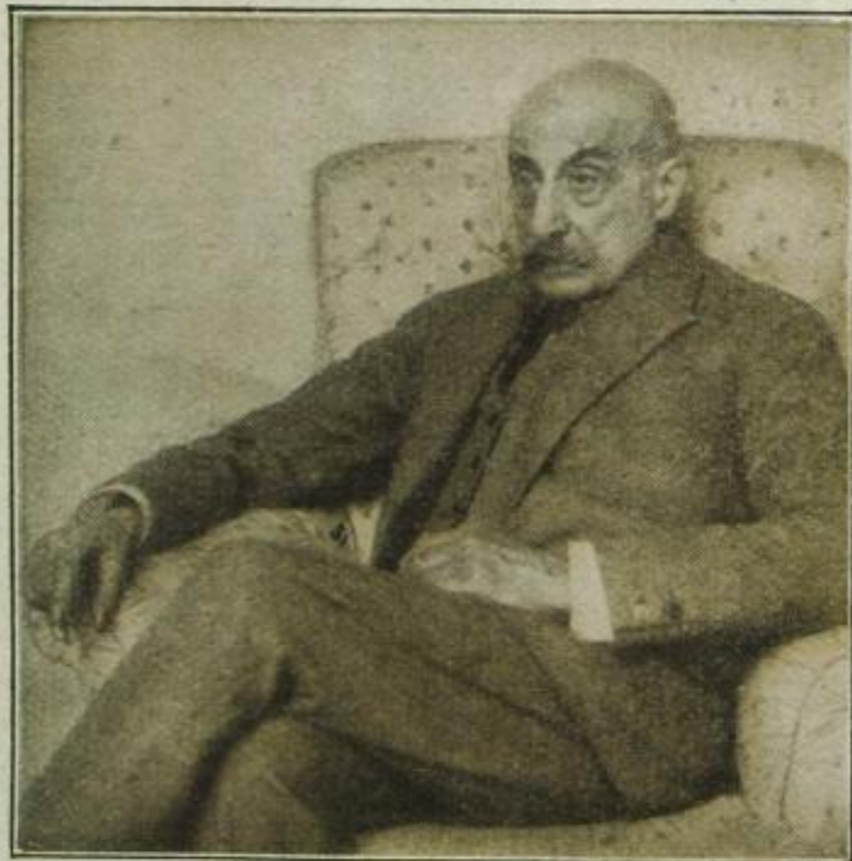
Max Liebermann mit 80 Jahren

daß diese Gebärden eben nicht anmutig sind), wirst du deine Hände auf irgendeine Weise versorgen, das heißt, in einen Zustand des Gleichgewichts und der Sicherheit bringen wollen. Fürs erste wirst du versuchen, sie in die Taschen zu tauchen — während des Versuches überfallen dich aber Zweifel, ob diese bequeme Lösung des Problems auch statthaft sei (ich nehme an, daß du