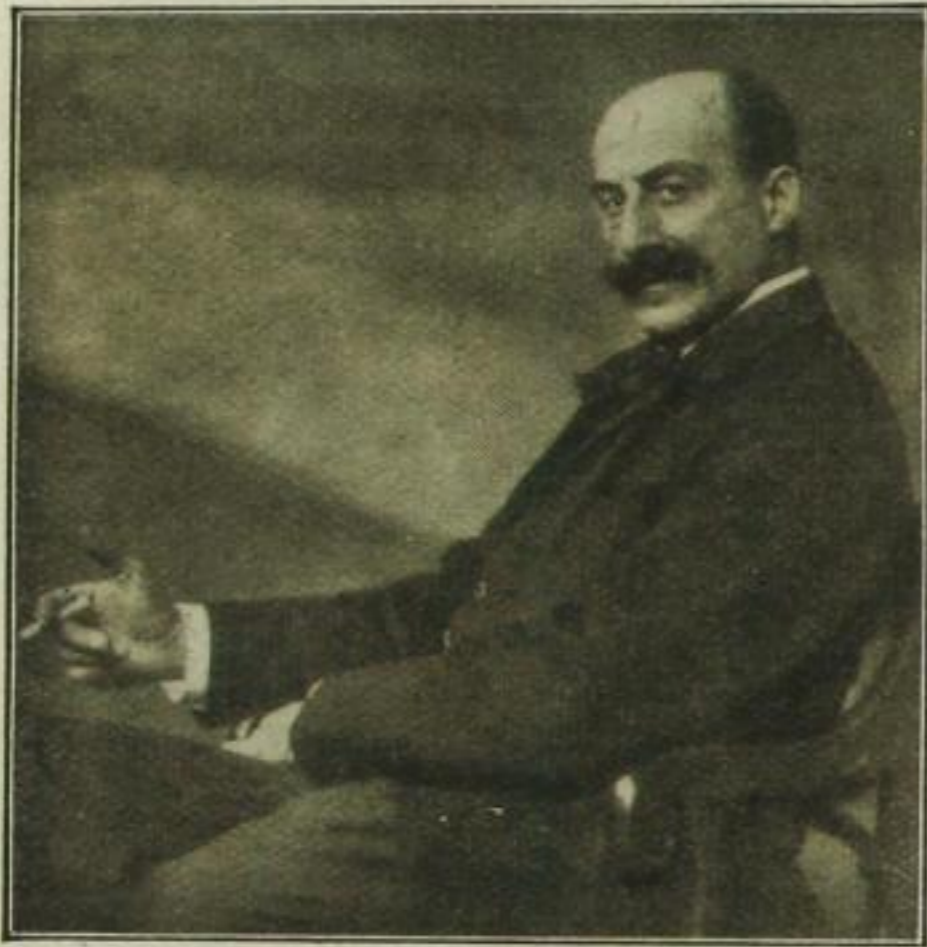
Max Liebermann mit 50 Jahren