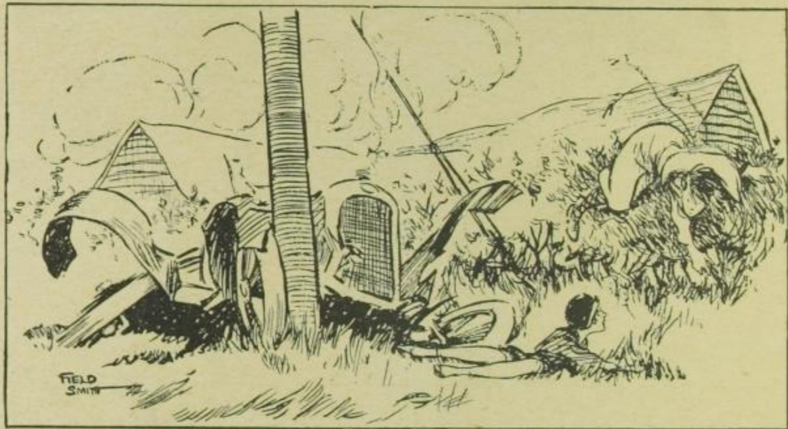
„Schatzi, was für ein Auto werden wir uns jetzt kaufen?“ (London Opinion)