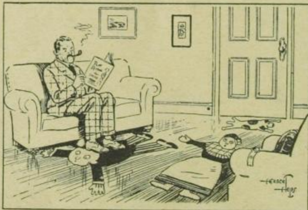
Neuer Sofavorleger für rücksichtslose Autofahrer, Marke „Fußgänger“. (Pearson)