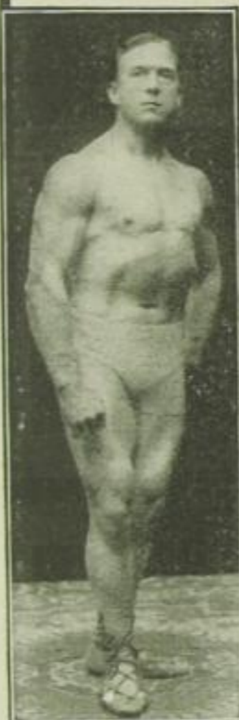
Strongfort, das Ideal männlicher Vollkommenheit

Jede Minute Ihres Lebens ist einmalig und unwiederbringlich. Wie viele wertvolle Stunden, die Sie zu Ihrem Vorteil und zu Ihrer Freude hätten nutzen können, gingen Ihnen schon verloren, weil Ihre körperlichen und geistigen Kräfte versagten, weil Sie den Situationen nicht gewachsen waren, weil Sie sich müde und unlustig fühlten, weil es Ihnen an Selbstvertrauen, Entschlußkraft, Willensstärke und Lebens-Energie mangelte? Wollen Sie noch mehr solcher ungeliebten Stunden, solcher versäumten Gelegenheiten, solcher ungenützten Möglichkeiten auf den Seiten Ihres Lebensbuches verzeichnen? Sicherlich wollen Sie das nicht. Darum muß es Sie interessieren, zu erfahren, daß alle Ihre Mißerfolge und Fehlschläge durch körperliche Mängel bedingt sind. Strongforts hoch interessantes und reich illustriertes