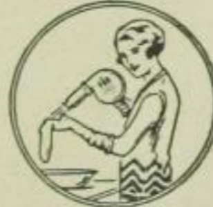
11. Trocknen v. Handschuhen, Strümpfen, kl. Wäschestücken usw.