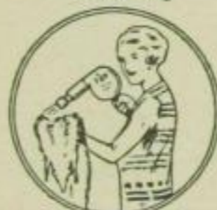
10. Einmotten durch Naphthalin-Zerstäubung