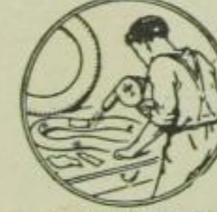
19. Trocknen von Gummi-Reparaturen