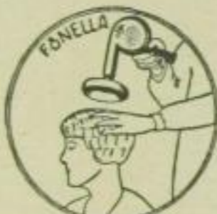
5. Zur Herstellung und Trockn. v. Wasserwell.