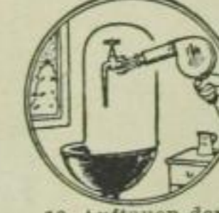
16. Auftauen der Wasserleitung