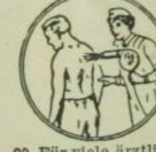
20. Für viele ärztliche Zwecke