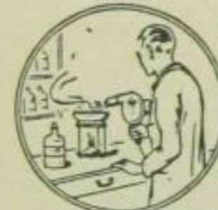
14. In chem. Fabriken und Laboratorien