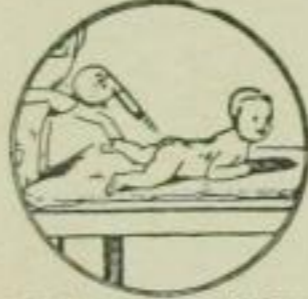
3. Schutz geg. d. Wundsein der Säuglinge