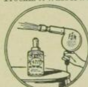
9. Zerstäuben von Parfüms