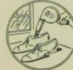
18. Trocknen v. durchnäßigem Schuhwerk u. b. schwitzenden Füßen