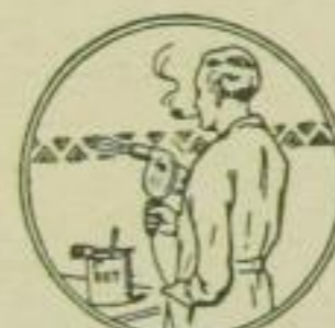
13. Trocknen kleiner Malerarbeiten