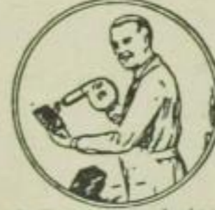
8. Trocknen photogr. Filme und Platten