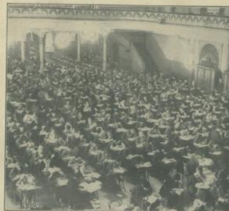
Ed. Pacific & Atlantic

„Bleiben Sie sitzen, Fräulein!“ . . . Büro-Rollstuhl auf Schienen, mit dem man am Kartothekisch hin- und herfahren kann