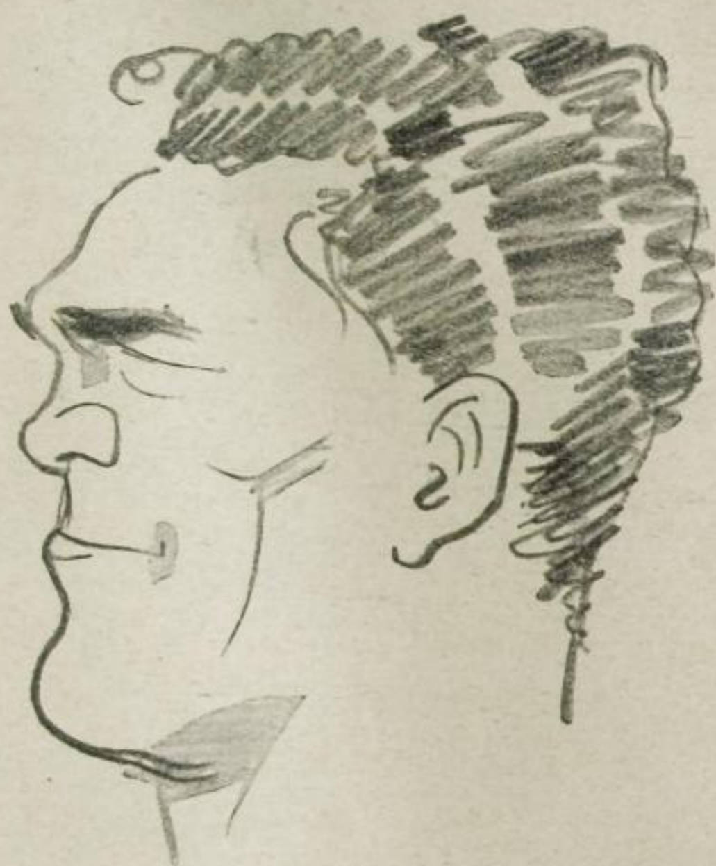
Zeichnungen von Gődör