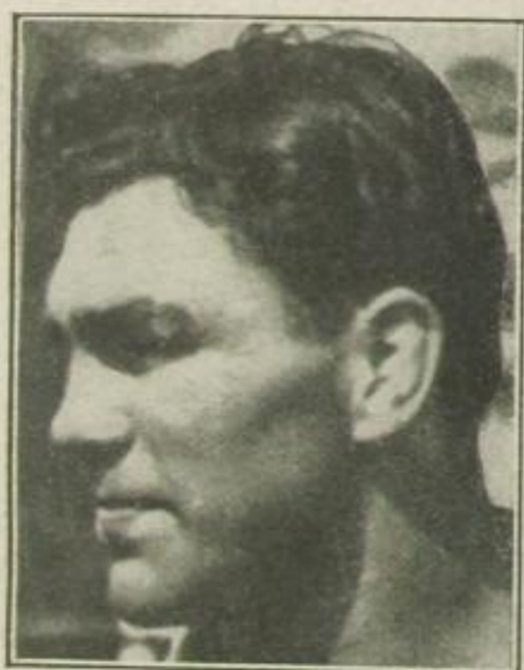
Max Schmeling, ...