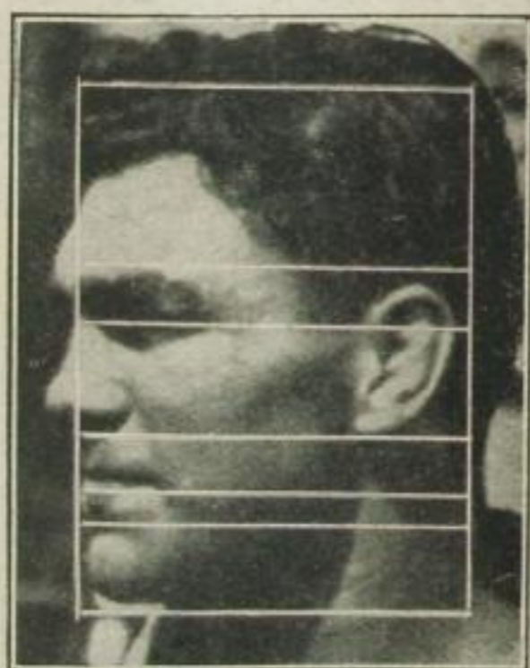
... in unseren Karikaturen- rahmen gespannt ...