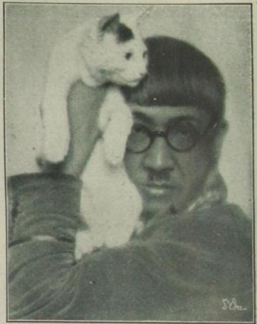
mit Katze . . .