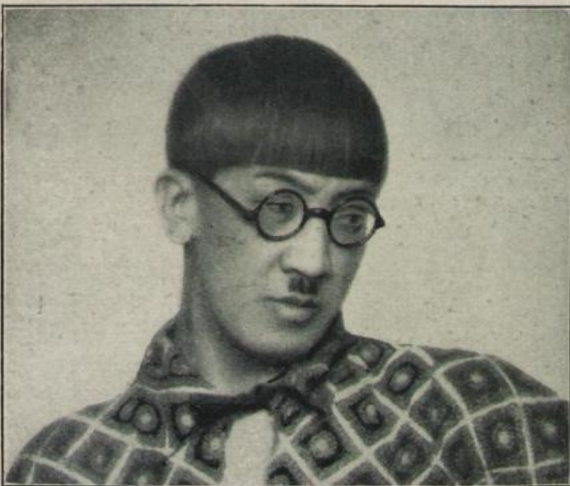
in einem neuen Kimono . . .