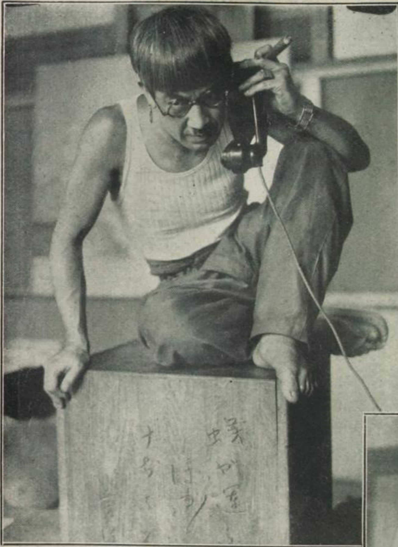
Foujita in einigen besonders japanischen Stellungen, wie sie der Pariser bewundert: Am Telefon . . .