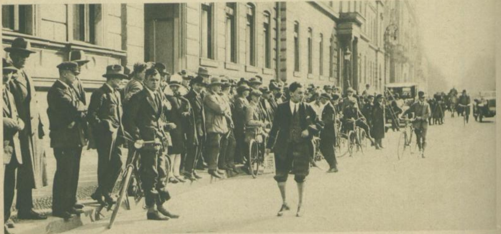
Großer Tag vor dem Portal Neugierige, die auf der gegenüberliegenden Seite zuschauen . . .