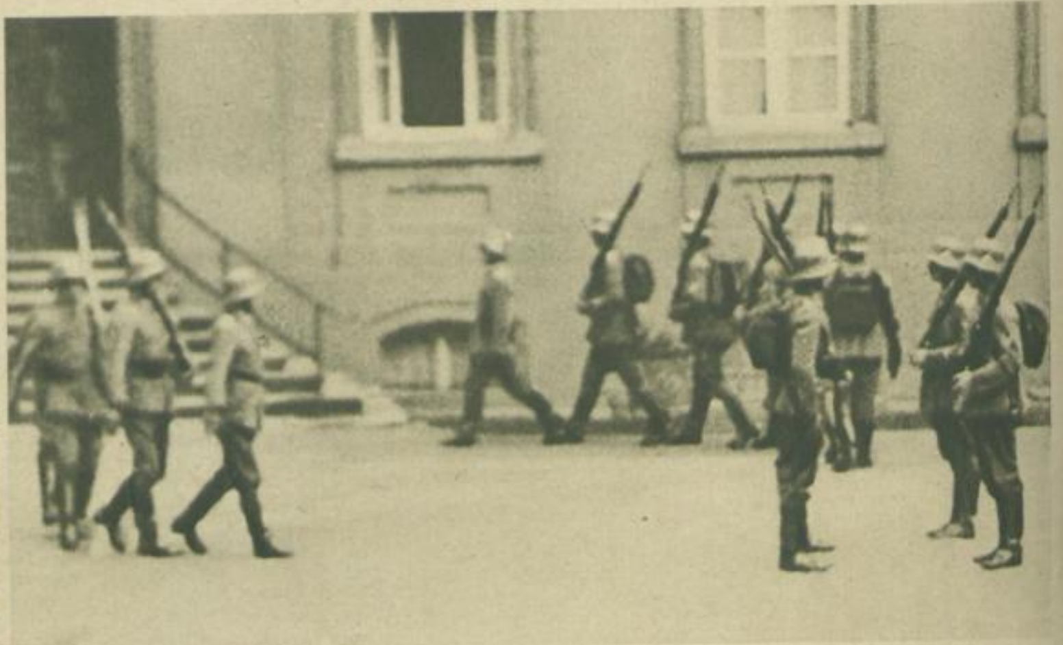
1230: Ablösung der Wache