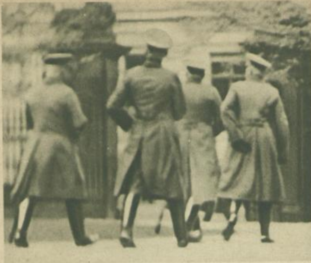
1205: Die Militärs verlassen nach ihrer Besprechung das Palais