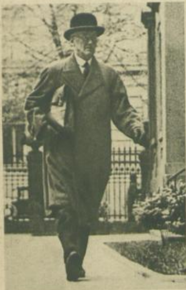
1250: Ministerialrat Dr. Doehle vom Büro des Reichspräsidenten