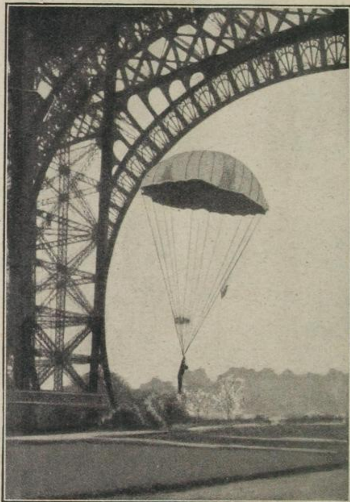
Eine berühmte Premiere vor 20 Jahren: Der erste Aeroplanfallschirm wird mit einer Puppe von der Spitze des Pariser Eiffelturms herabgestürzt und bewährt sich.