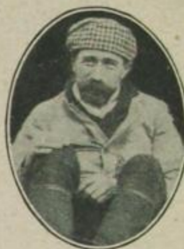
Eine Leistung im Jahre 1911: Roger Sommer, der zum erstenmal einen Aeroplanaufstieg mit 6 Personen unternahm.