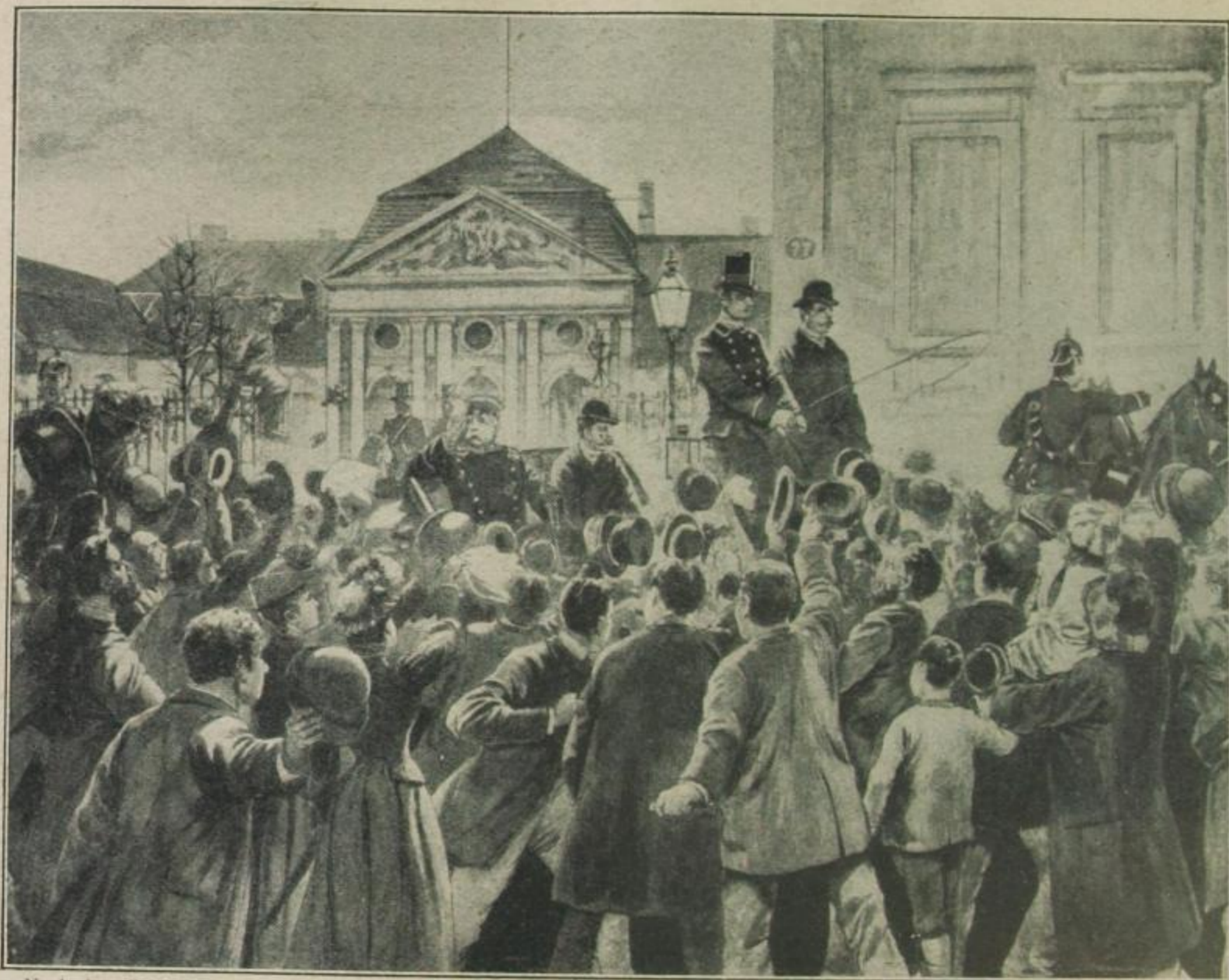
Nach einer Zeichnung von R. Knotel