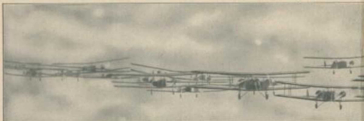
1. Aufnahme: Amerikanisches Flugzeuggeschwader von vorn gesehen . . .

Man glaubt beim Anblick dieser Aufnahme, daß sämtliche Flugzeuge im nächsten Augenblick miteinander karambolieren müssen . . .