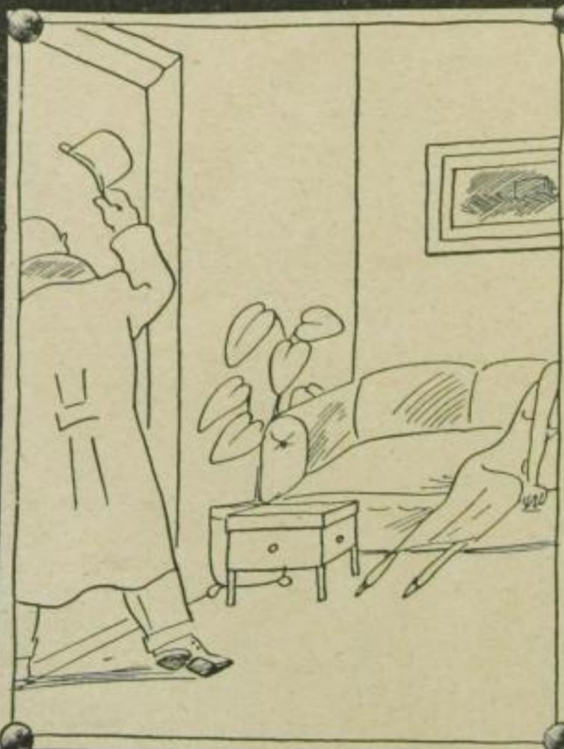
Ich habe eine dringende Sitzung