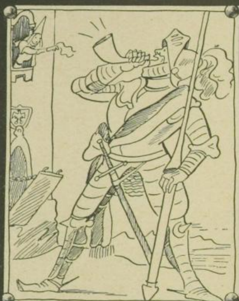
Ich ziehe in den Krieg