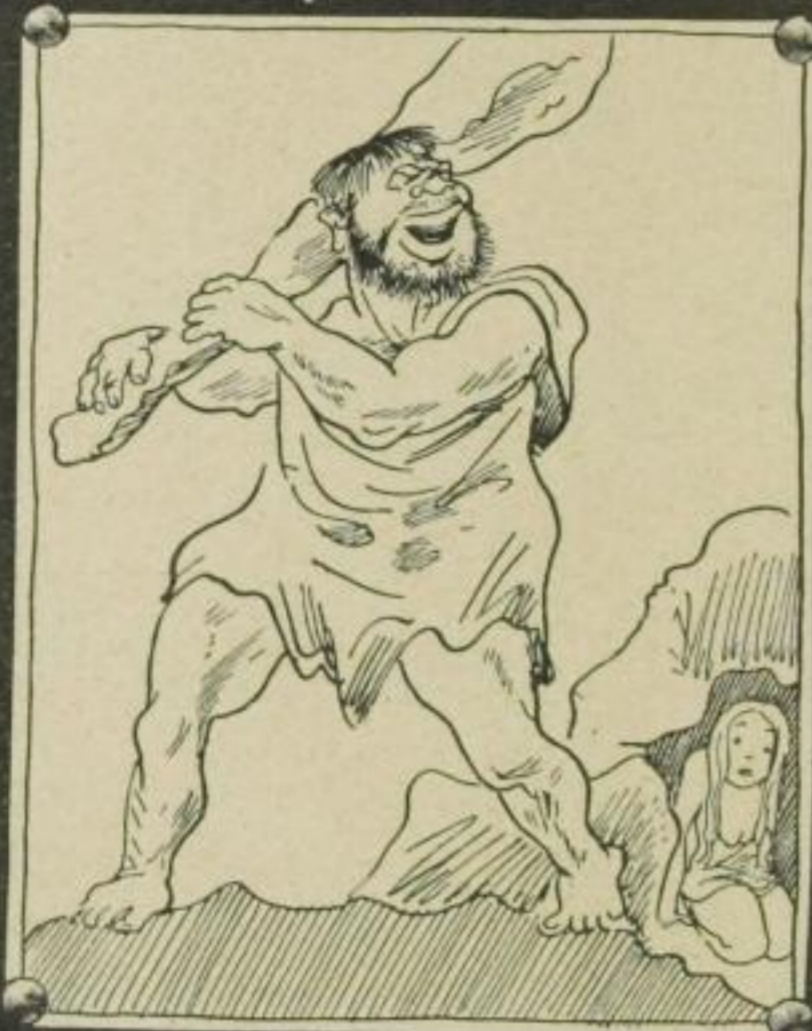
Ich gehe auf die Jagd