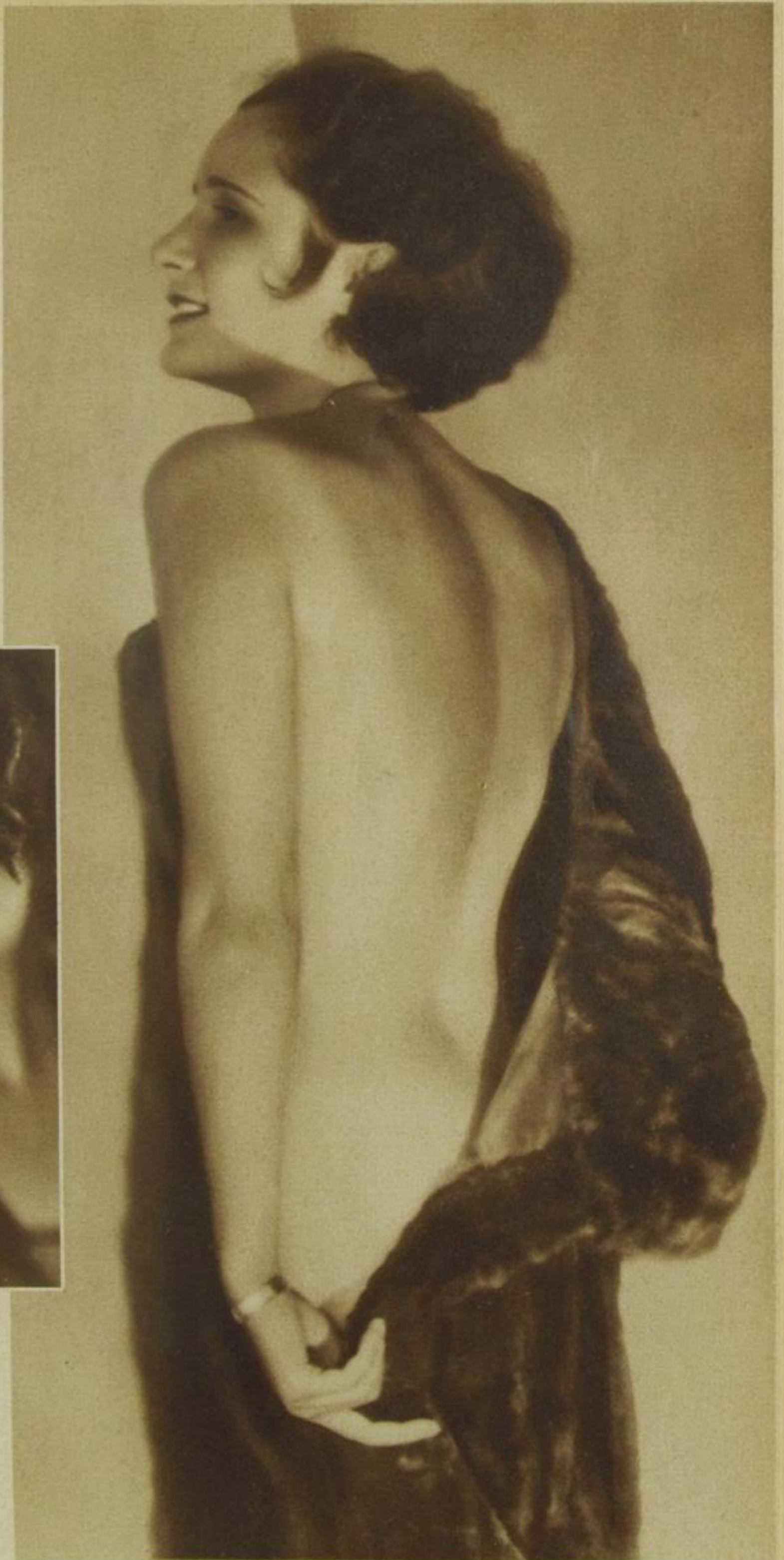
Die Gilde der künstlerischen Fotografen entdeckt die Schönheit des Halbaktes:

Frau L. wird à la Beardsley aufgenommen.