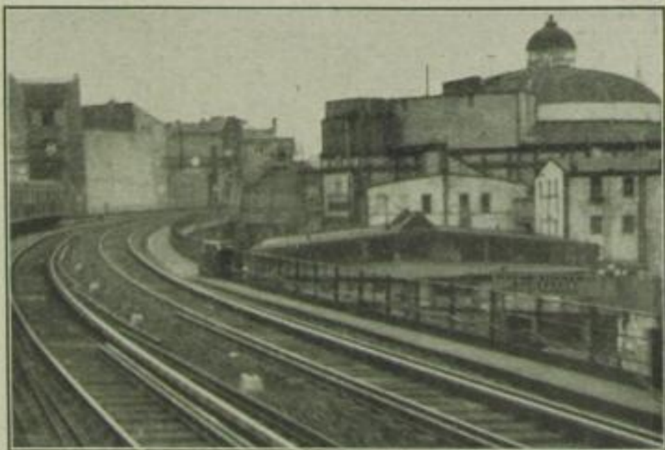
Eine Stelle der Stadtbahn, die jedes Berliner Kinderherz höher schlagen läßt: Kuppel und Stallungen des Zirkus Busch.