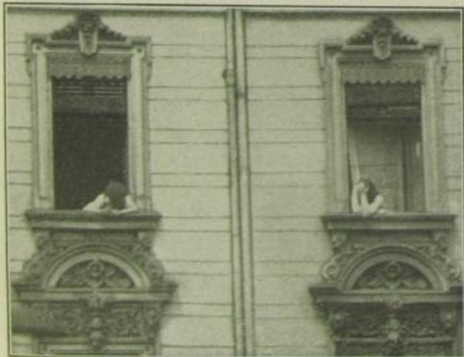
Ein kleiner Flirt von Fenster zu Fenster in der Dircksenstraße.