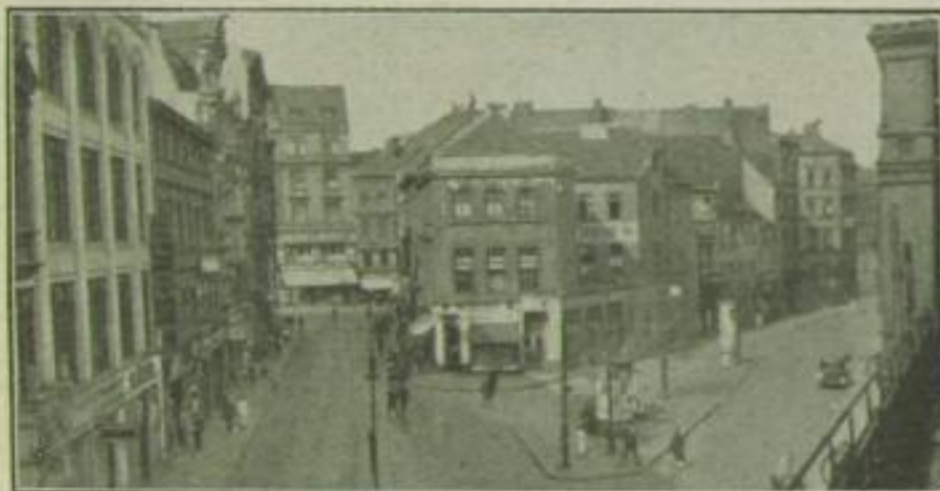
Ein stiller Altberliner Winkel: Unmittelbar vor der Einfahrt zum Bahnhof Börse, eine Straße breit getrennt von dem verkehrsüberfluteten Hackeschen Markt.