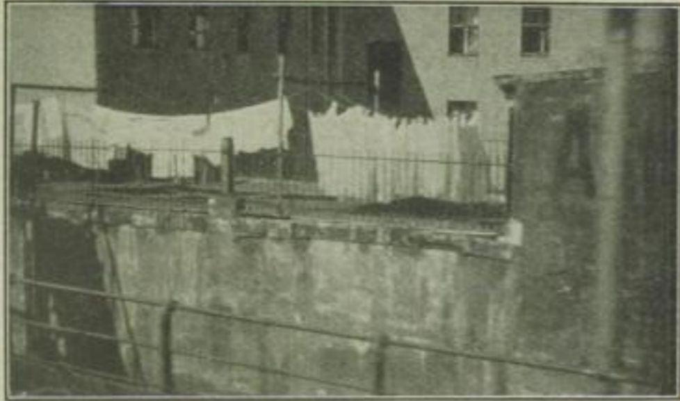
Vorn an der Straße ist ein Schild: Wäscherei und Plättereier.