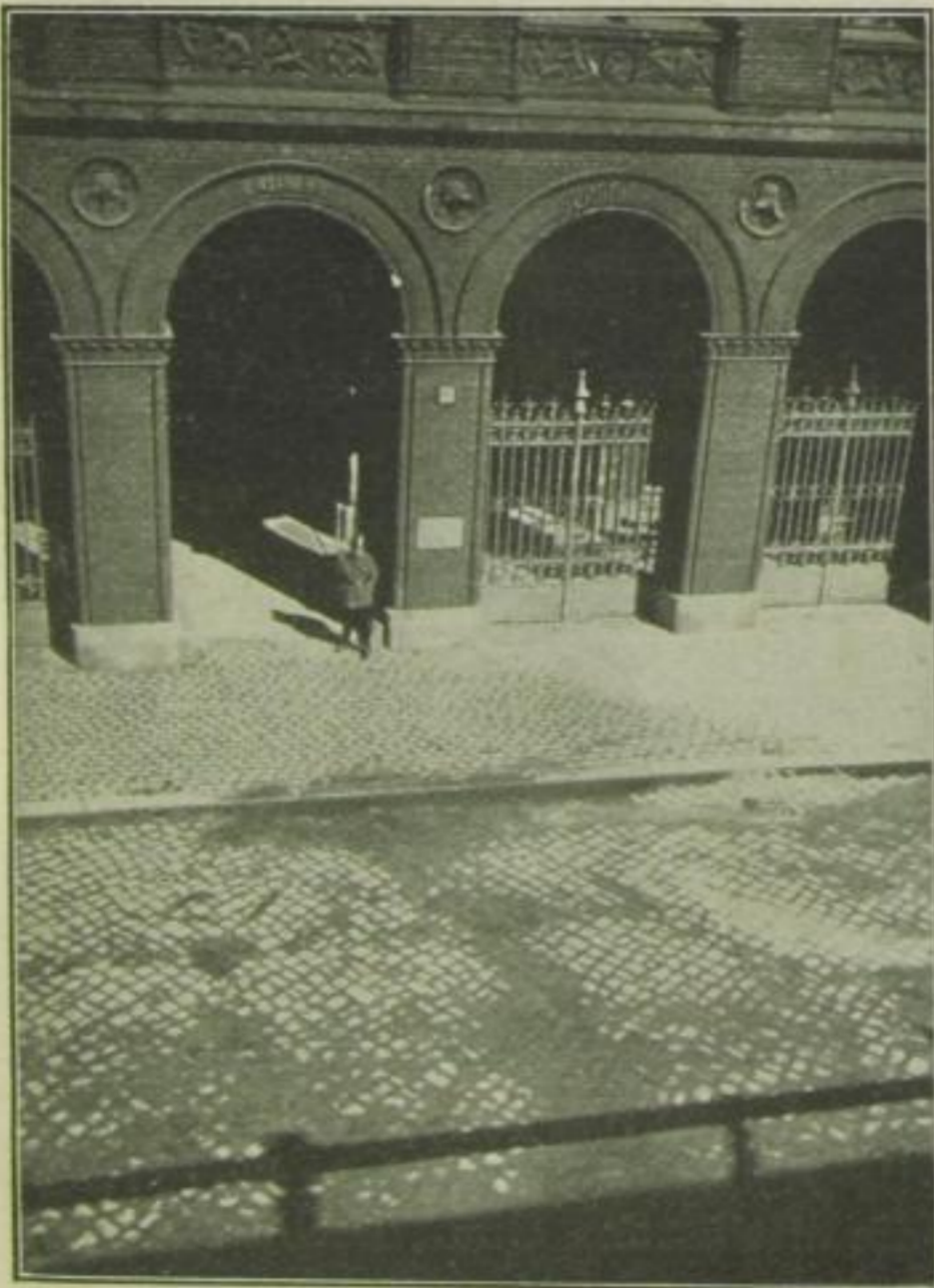
Polizeipräsidium am Alexanderplatz, Einfahrttor für „die grüne Minna“ (der grüne Wagen, der die Verhafteten zum Präsidium bringt).