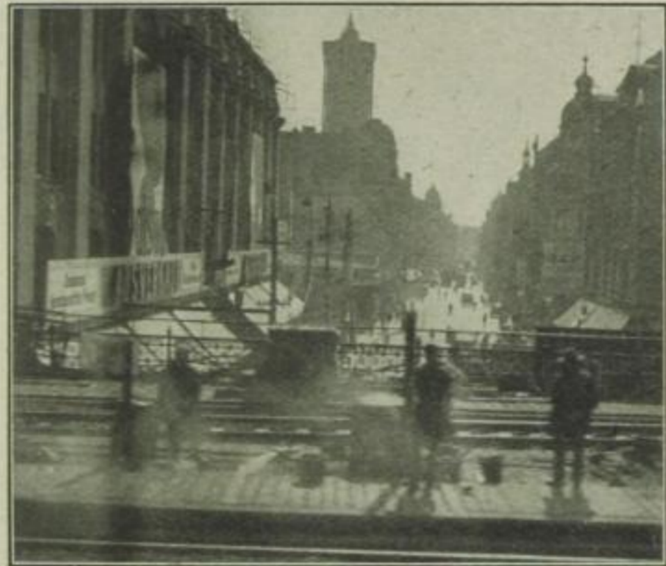
Blick vom Bahnkörper Alexanderplatz auf das Rathaus und die Königstraße.