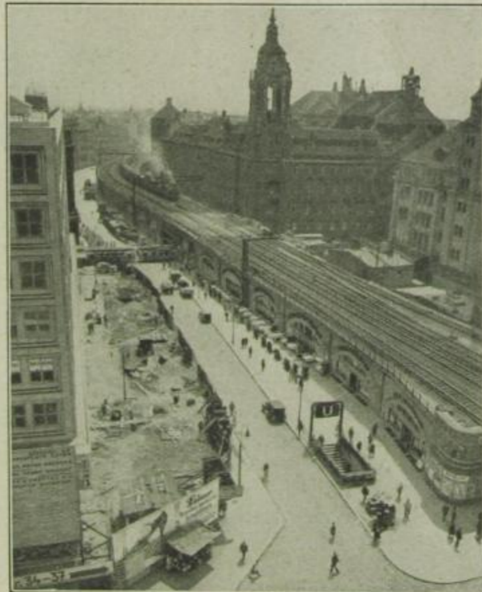
Blick auf den Bahnkörper am Alexanderplatz.