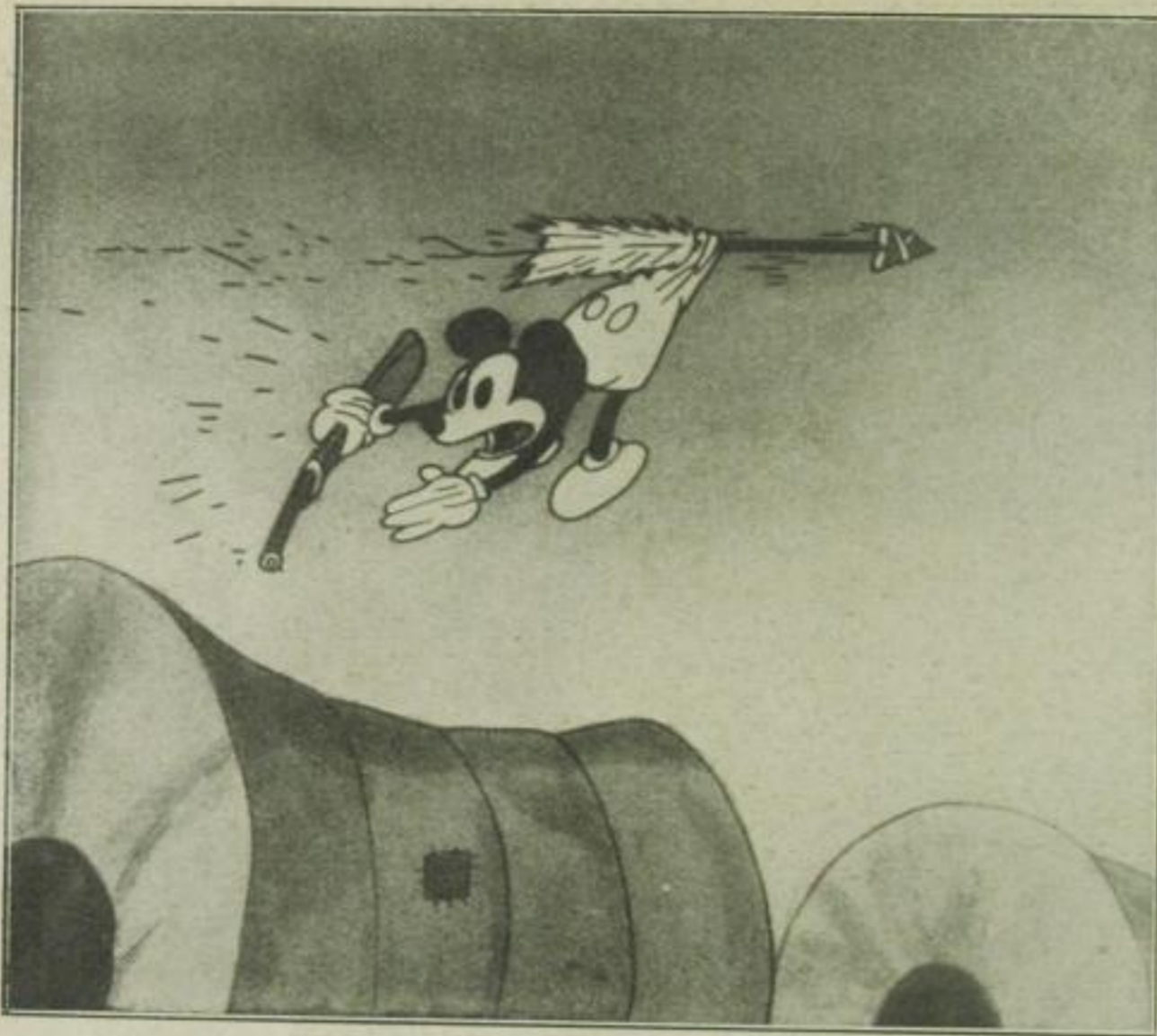
Mickey Maus rettet sich mit Hilfe eines abgeschossenen Indianerpfeiles aus dem eingeschlossenen Lager

Los Angeles einkaufen gegangen. „Warum zu Fuß und warum so weit?“ Ja, Mickey Maus ist in Gefahr, dick zu werden.