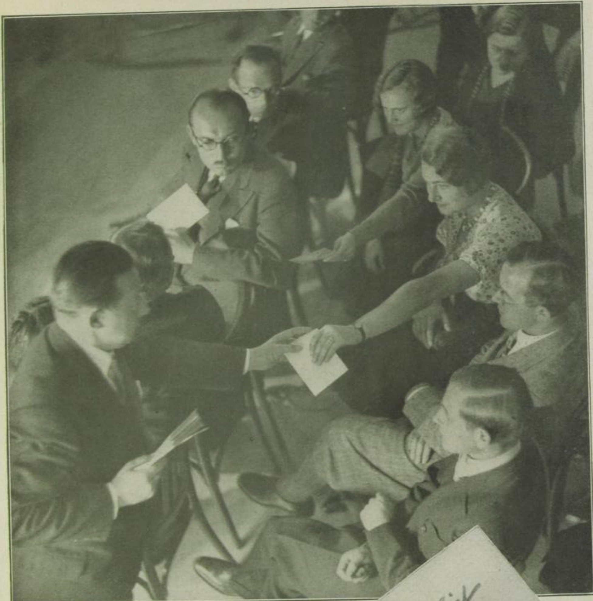
Der Kontakt mit den Hilfesuchenden Während Gubisch die Umschläge mit den Zetteln einsammelt, prägt er sich die markantesten physiognomischen Züge der Zettelschreiber ein.