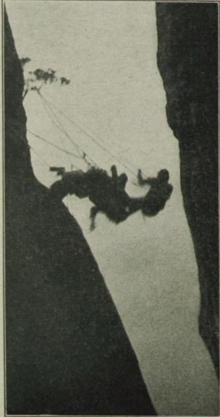
8. Oder aber — falls er keinen Halt findet — stürzt alles in sich zusammen . . .