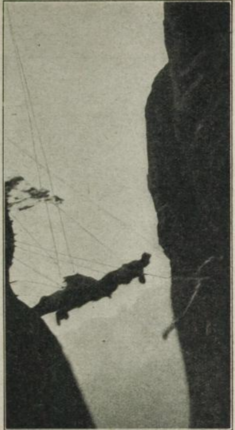
6. Nun muß ein vierter von den Schultern des dritten aus, halb fallend, halb springend, den Fels zu erreichen suchen.