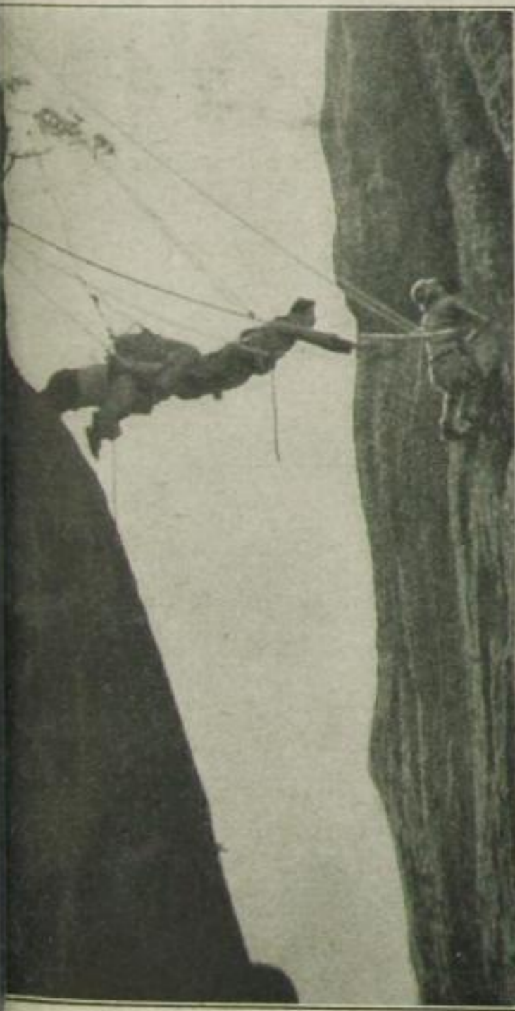
7 Dieser letzte hats als erster geschafft.