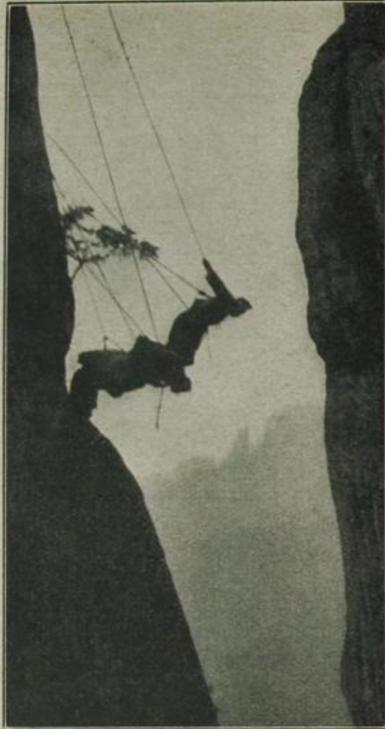
5. . . . und lehnt sich ebenfalls so weit hinüber wie möglich.