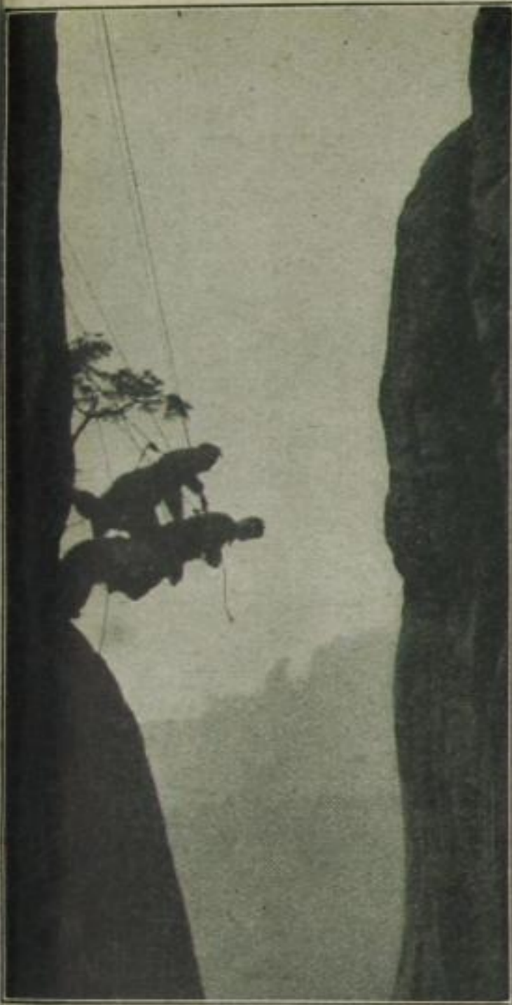
4. Der dritte klettert auf die beiden hinauf . . .