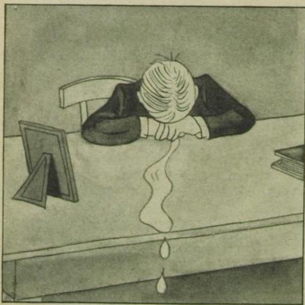
Wenn „sie“ nein sagt . . .