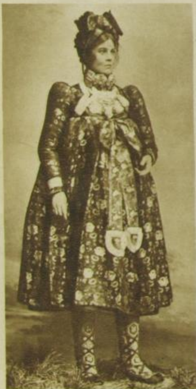
. . . von dem Dachauer Mädchen die buntgemusterten wollenen Strümpfe . . . Sammlung Lipperheide

von dem Mädchen aus Garmisch die hübsche gestrickte Weste mit den hellen Knöpfen und ihre viereckig ausgeschnittene Bluse . . .