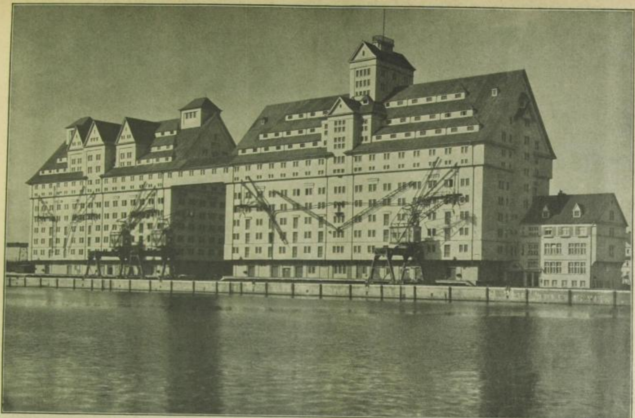
Der gewaltige Getreidespeicher im Königsberger Hafen, mit 50.000 Tönnen der größte aller europäischen Silos.