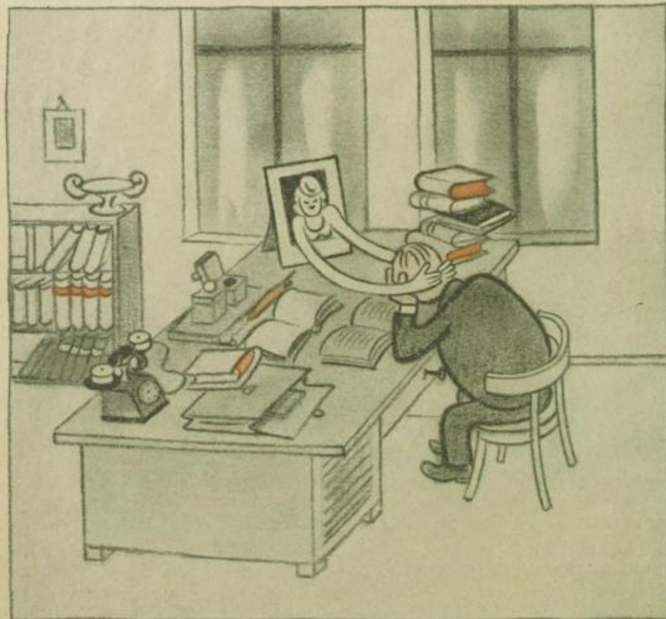
Bei trübem Wetter ist manch einer nicht in Arbeitsstimmung, und Erinnerungen an vergangene Tage fallen über ihn her.

Es gibt wohl keinen Menschen auf dieser Welt, dessen Stimmung nicht irgendwie vom Wetter abhängt. Es ist eine Binsenwahrheit, daß unangenehme Ereignisse im Schein der lachenden Sonne eher optimistisch betrachtet werden, umgekehrt aber erfreuliche Ereignisse bei trübem Wetter nicht mit der Freude aufgenommen werden, die sie eigentlich verdienen. Das Wetter hat die unheimliche Eigenschaft, die Dinge in seinem Licht erscheinen zu lassen. Hieraus folgen einige praktische Winke: Briefe mit dem Stempel des Gerichts oder verwandten Kennzeichen nur im Sonnenlicht öffnen; ein entscheidendes Telefongespräch am besten aus der Telefonzelle im Freibad erledigen und vor allem bei Bekannten und Freunden, die öfter Geld zu pumpen pflegen, immer und immer wieder verbreiten, man sei überhaupt nur in guter Stimmung bei der Wetterkombination von Vollmond und Regen.