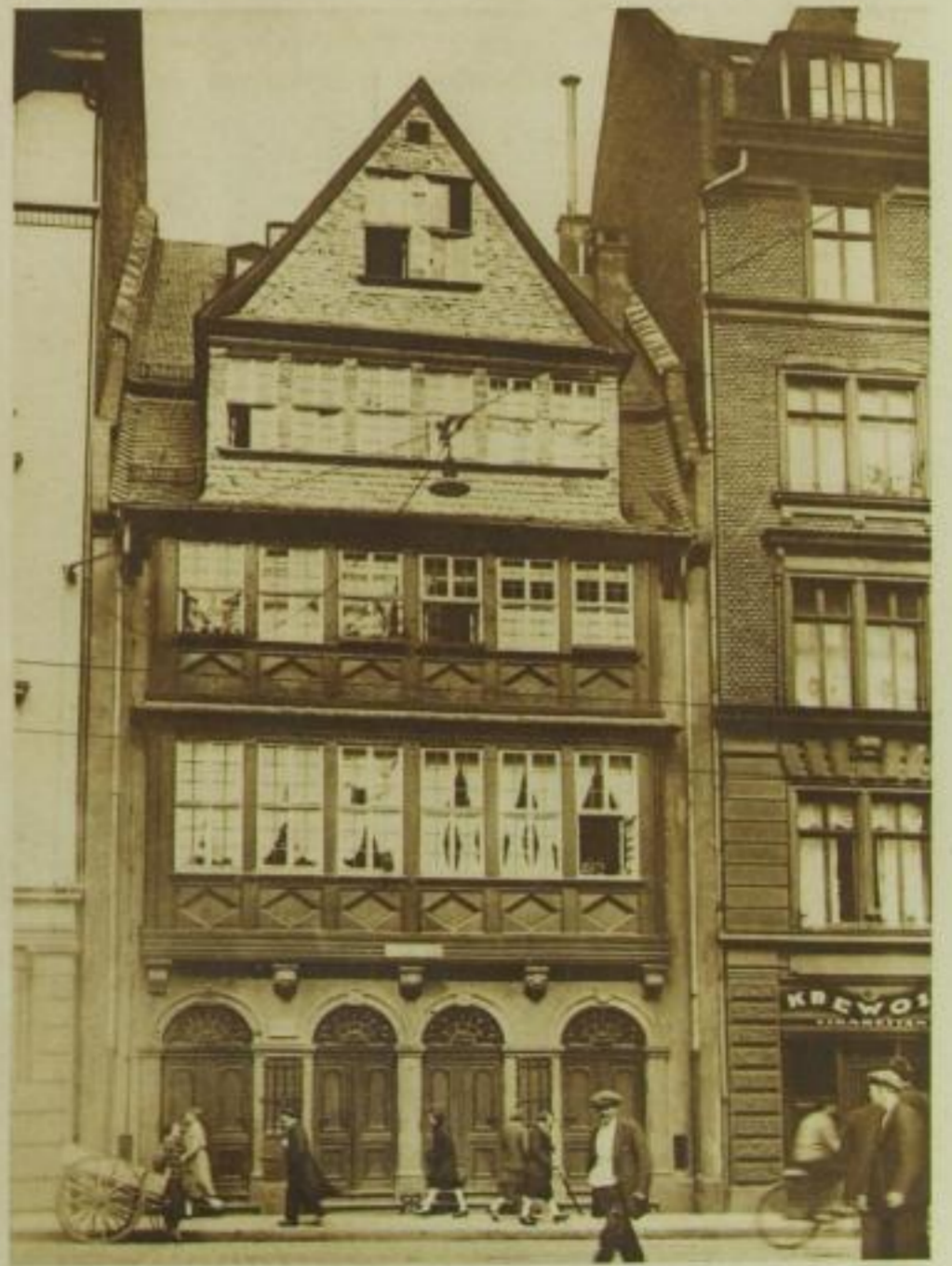
Das Stammhaus der Rothschilds — heute ein Museum