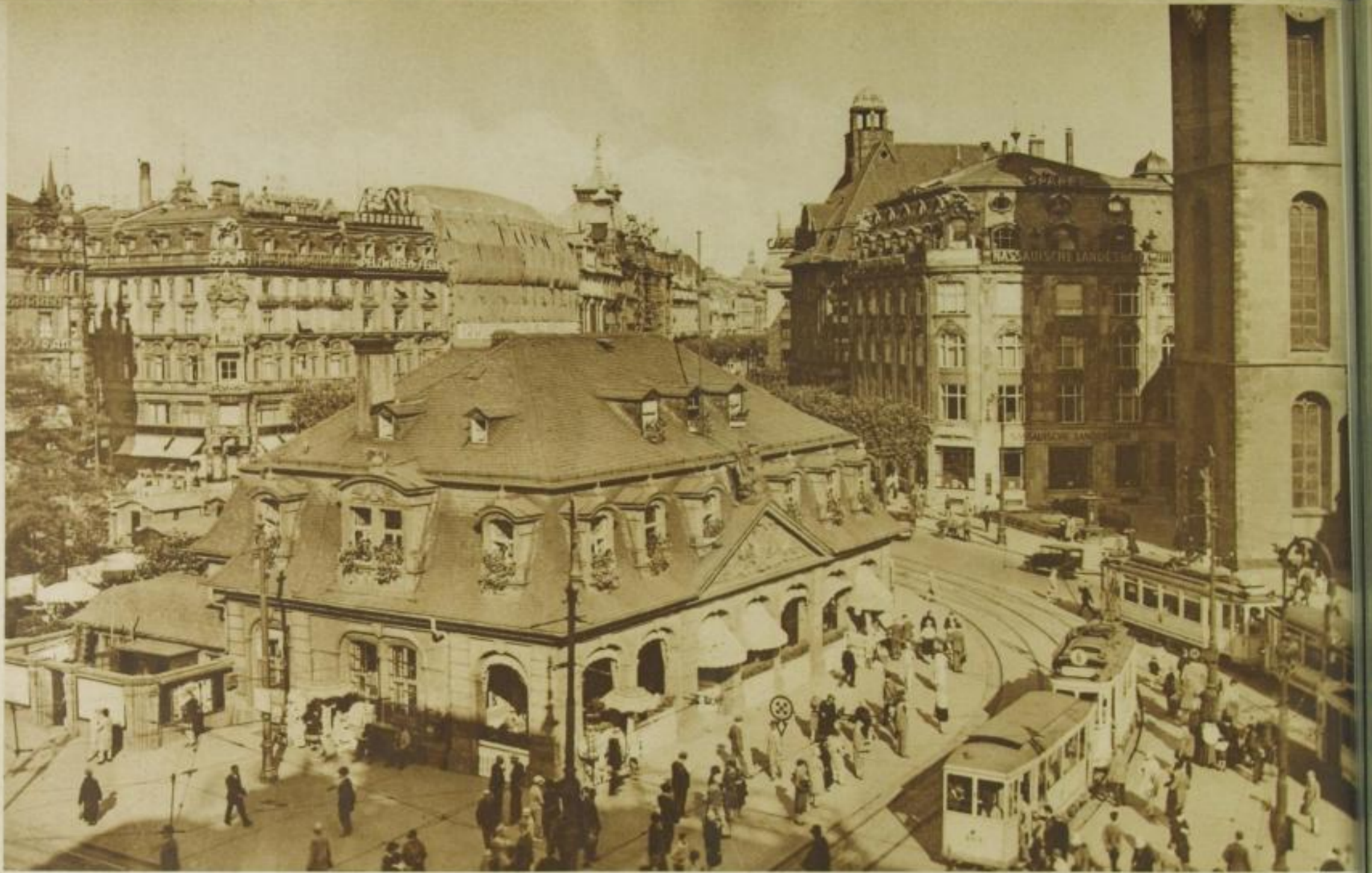
Die Hauptwache — ein Renaissance-Bau aus dem Jahre 1709, in dem früher die Stadtmiliz untergebracht war. Heute ein beliebtes Kaffeehaus und Treffpunkt der Sonntags-Ausflügler, von wo sie mit der Straßenbahn nach dem Launus und dem Stadtwald fahren.