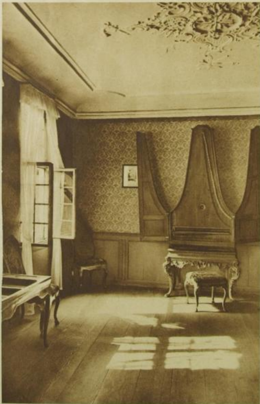
Musikzimmer im Goethehaus