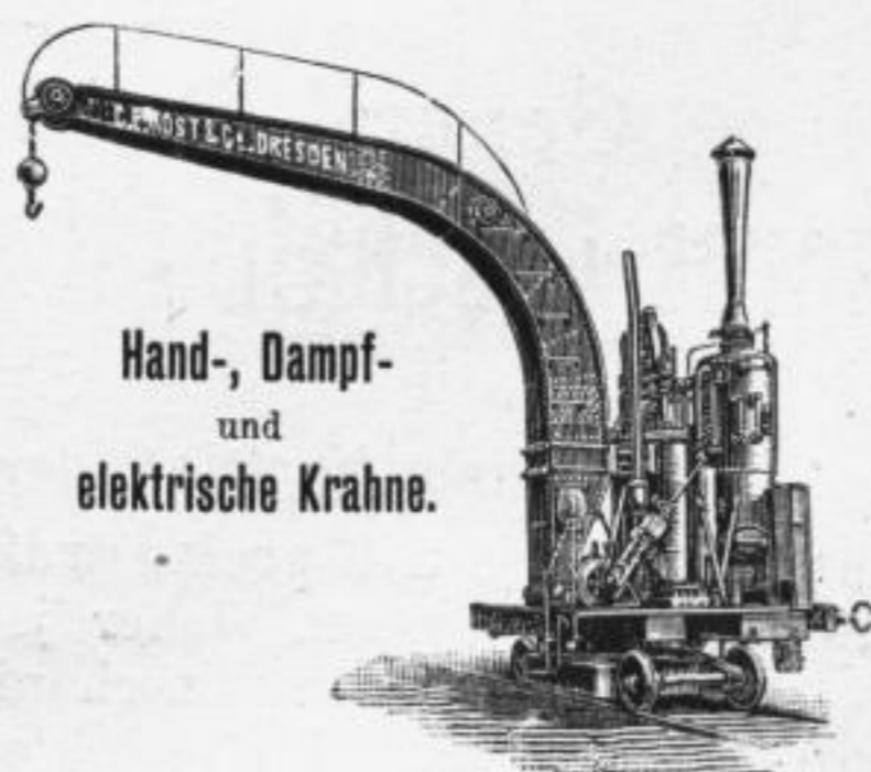
Hand-, Dampf- und elektrische Krahnne.